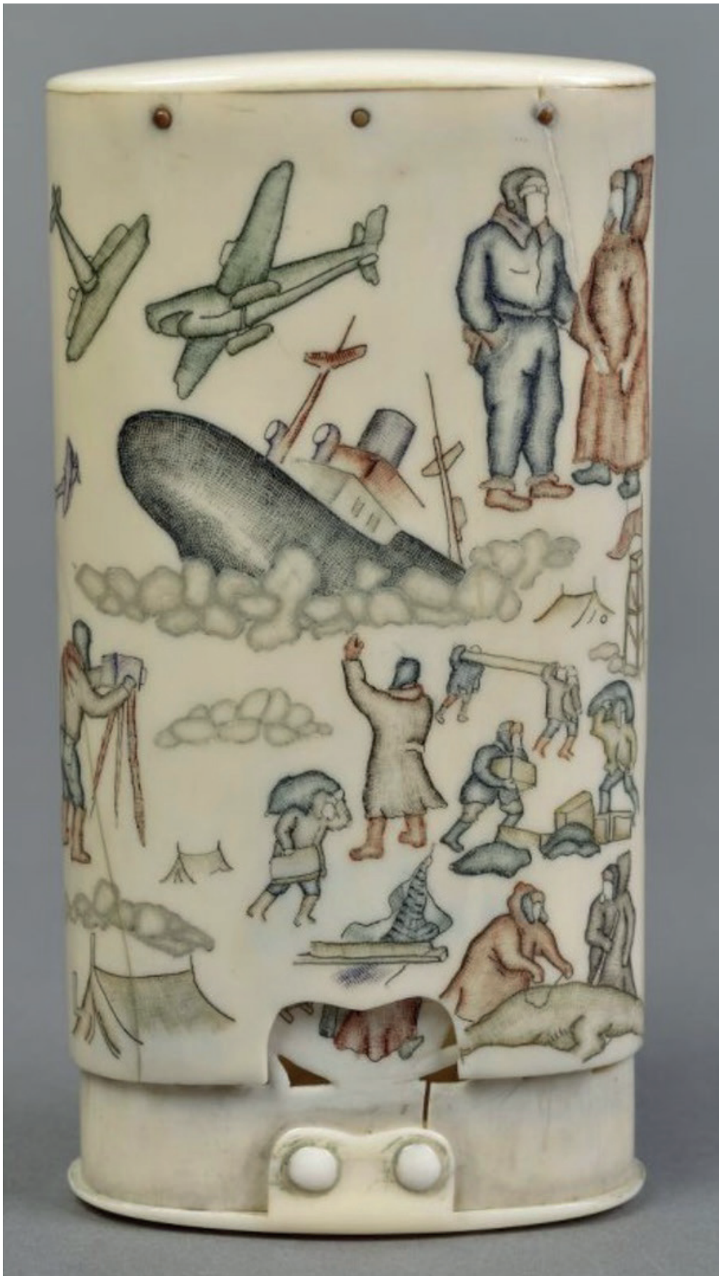
Рис. 4. Портсигар разъемный «Челюскинцы». Внешняя часть. Клык моржа, резьба, гравировка цветная. 1935 г. Автор рисунка – Вуквол. Всероссийский музей декоративного искусства