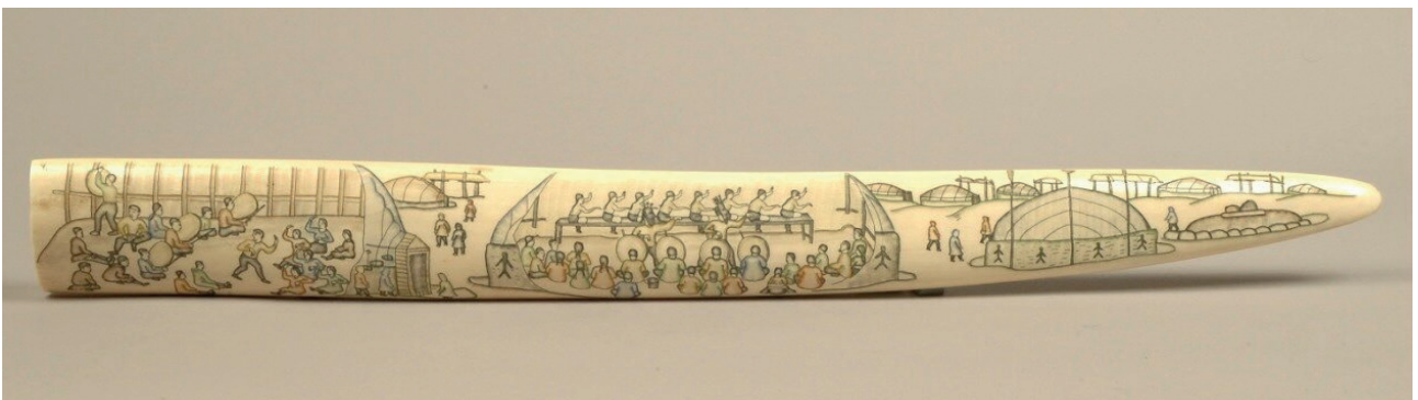
Рис. 7. Гравированный клык «Праздник кита». Клык моржа, гравировка цветная. 1956 г. Мастер – Вера Эмкуль. Государственный музей Востока