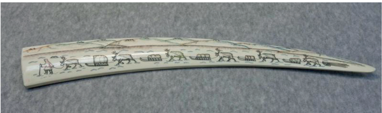
Рис. 9. Гравированный клык «Олений поезд». Клык моржа, гравировка цветная. 1964 г. Мастер – Вера Эмкуль. Музейный центр «Наследие Чукотки»