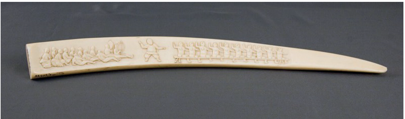
Рис. 6. Гравированный клык «Танцы на празднике кита». Клык моржа, рельефная резьба. 1930-е гг. Мастер – Яхган. Государственный центральный музей современной истории России