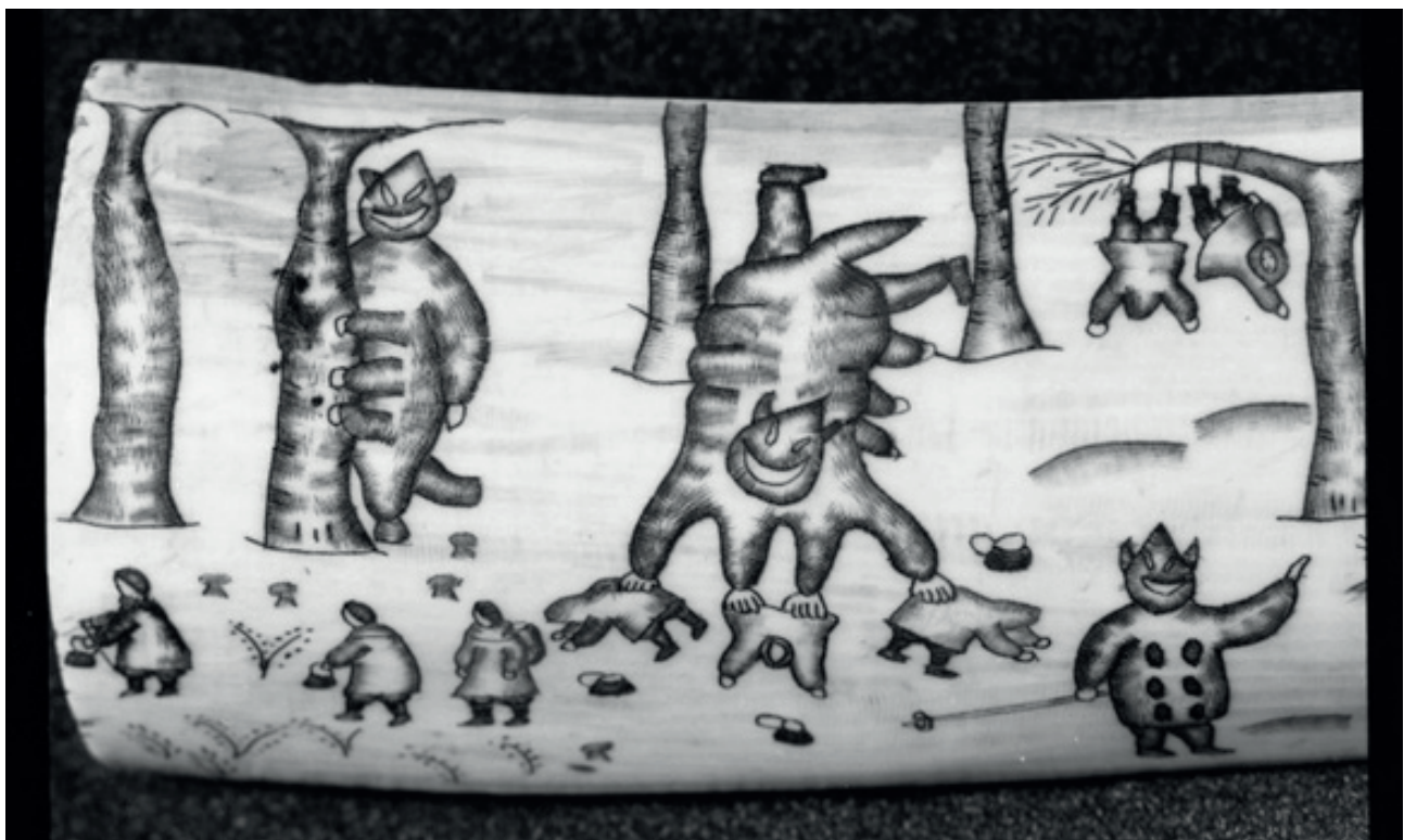
Рис. 11. Гравированный клык «Келе и девки» (фрагмент). Из коллекции негативов по теме «Чукотские сказки». Клык моржа, гравировка цветная. 1945 г. Мастер – Надежда Краснова. Всероссийский музей декоративного искусства