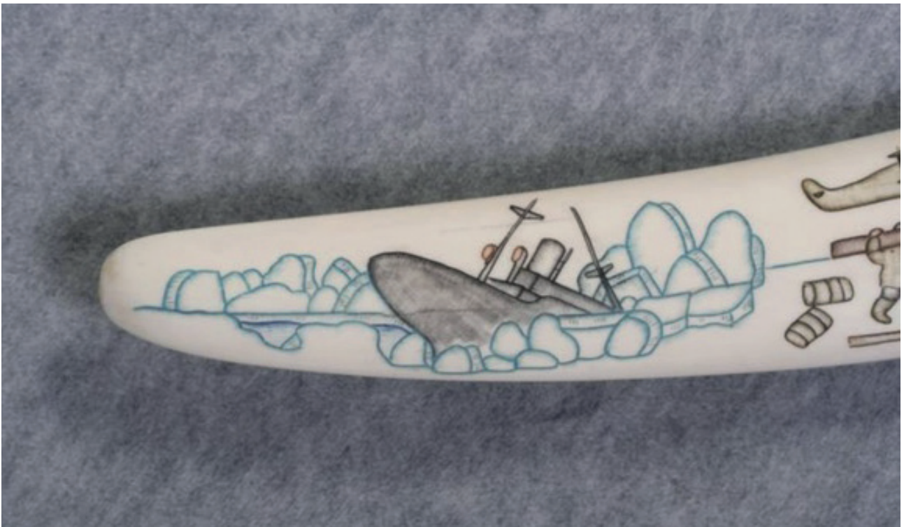
Рис. 5. Гравированный клык «Челюскинцы» (фрагмент). Клык моржа, гравировка цветная. 1985 г. Мастер – Илькей Е.Т. Музейный центр «Наследие Чукотки»