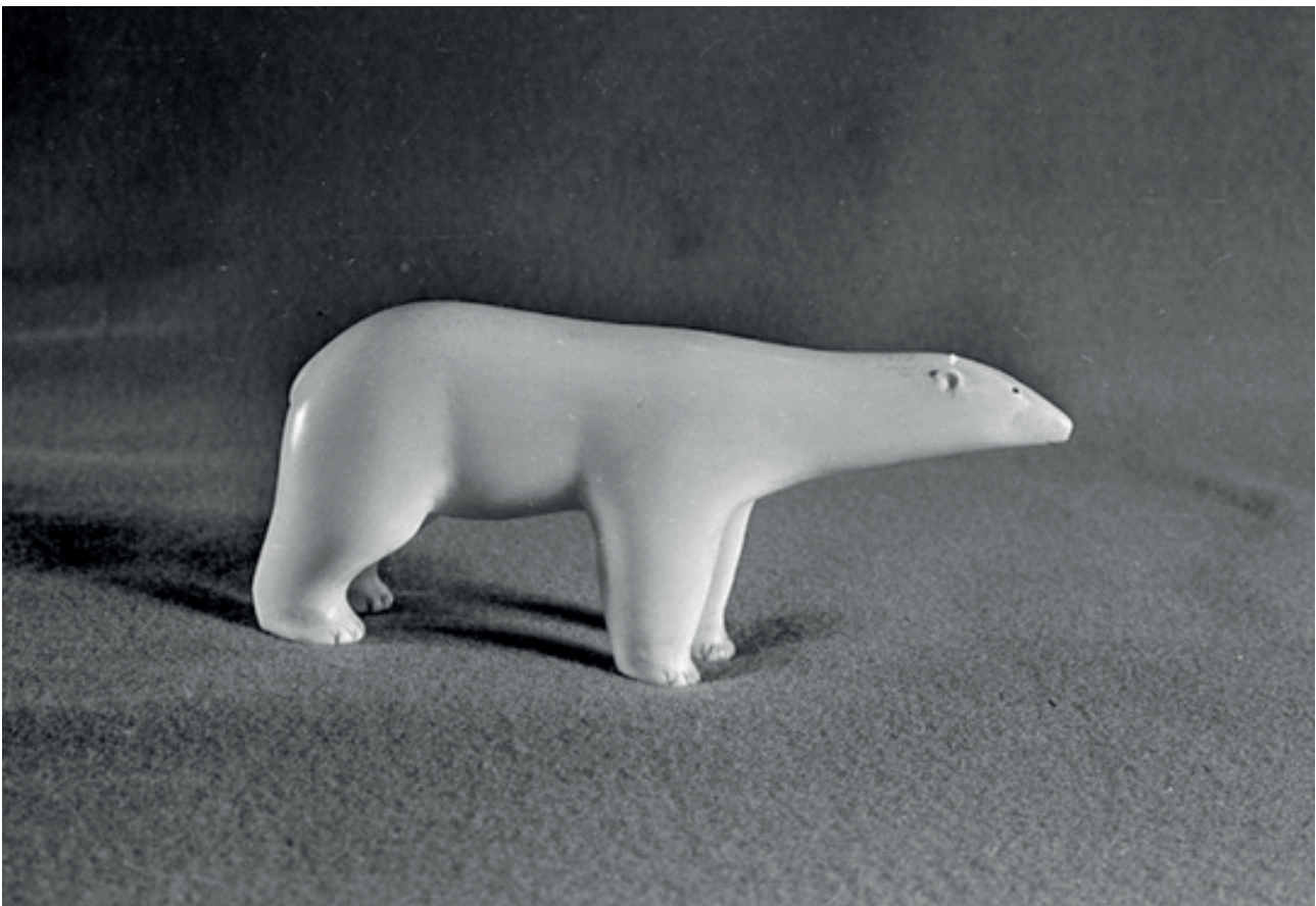
Рис. 2. Скульптура «Медведь». Клык моржа, резьба. 1930-е гг.

Метод ваяния применялся при работе над круглой скульптурой из моржового клыка, которую Горбунков в своих записях называет «накомодниками». Чаще всего это были фигурки морских зверей или диких животных, обитающих на просторах Чукотского полуострова: нерпы, моржи, белые медведи (Рис. 2), киты, песцы, зайцы, олени. Редко в первой трети XX в. мастера