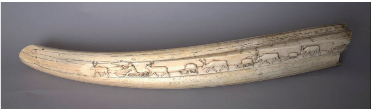
Рис. 8. Клык моржа «Олений поезд, аргиш». Клык моржа, рельефная резьба. 1920-е – 1930-е гг. Неизвестный мастер. Российский этнографический музей