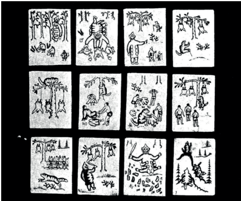
Рис. 10. Таблетки по сюжетам сказки «Келе и девки». Клык моржа, гравировка. 1934 г. Мастер – Рыпхыргын. Сергиево-Посадский государственный историко-художественный музей-заповедник