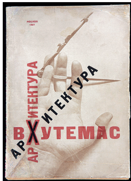
图3：艾尔·李西斯基设计的《呼捷玛斯建筑》封面，1927年

阶级的利益和形式，虽然列宁本人不主张暴力形式，但是构成主义本身就是一种对以往各种形式的暴力革命。 ⑥ “十月革命”后，全新的政治环境给艺术家和设计师们创造了广阔的空间和自由表