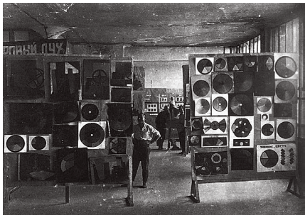
图4：呼捷玛斯色彩教室