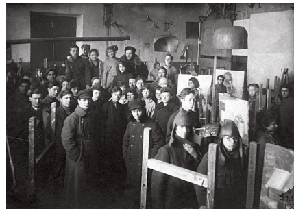
图2：呼捷玛斯学生，1922年