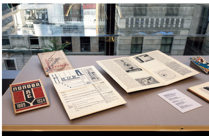
图6：纽约现代艺术博物馆举办的《包豪斯·呼捷玛斯——相交的平行线》展览，2018年9月25日至11月9日

传达的机会。此时，漂泊海外的艺术家怀着济民救世的理想，纷纷回到苏联，准备在崭新的土地上大显身手。所有的建筑和设计领域的专家在呼捷玛斯学习艺术，画家，雕塑家和图形艺术家，剧院建筑师和艺术家，纺织工人，住宅和公共建筑的家具和室内设备设计师等，他们用自己的艺术创作为苏维埃政权的文化建设服务，积极地用艺术的手段为革命宣传，歌颂崭新社会，鼓舞生产（图1、图2）。