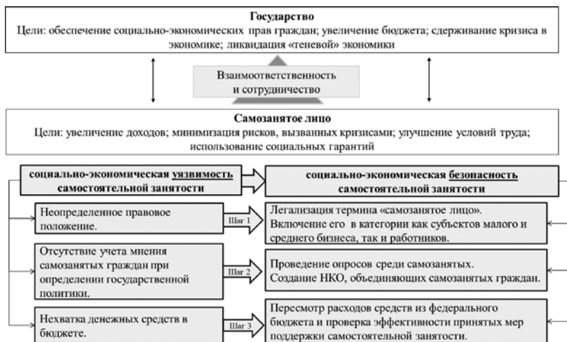
Рис. 2. Механизм адаптации самозанятых граждан к кризисным условиям

Суммируя вышесказанное, мы предлагаем авторский механизм адаптации самозанятых граждан к кризисным условиям, комбинирующий технико-правовые, гражданско-правовые, административные и финансовые инструменты (рис. 2).