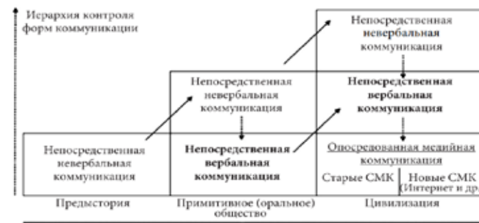
РИС. 1. Эволюция форм коммуникации по М. Бергхауз

В связи с этим стоит обратиться к эволюционно-коммуникативной теории немецкой исследовательницы М. Бергхауз, изложенной в работе «Как влияют средства массовой коммуникации». Данная концепция, на наш взгляд, обобщает множество теоретических работ по эволюции социальной коммуникации, в частности Маклюэна и социолога Н. Лумана. Бергхауз делает акцент на общий вклад разных средств коммуникации в социальные связи. Возникают функционально иерархизированные отношения, которые мы в целях экономии места поясним рисунком, заимствованным у Бергхауз.