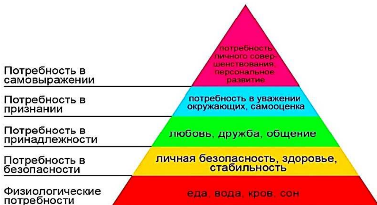
Рисунок 1. Пирамида Маслоу.

Маслоу сформулировал несколько принципов, характеризующих природу человека [6, 7]: