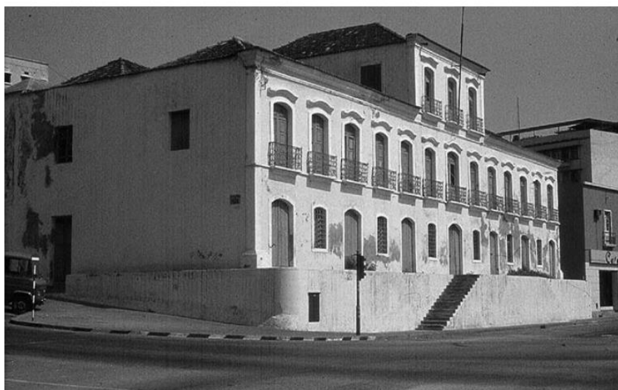
Илл. 1. Дворец Аны Хоакины, Луанда, 1973 г.

XVIII веке, является одним из ценнейших образцов гражданской архитектуры в Анголе (см. илл. 1). В облике дворца отмечаются четко соблюденная пропорциональность и удачно созданная архитектурная композиция. Множество высоких балконных окон на верхних этажах придают зданию более богатый вид. Однако дворец в целом выглядит довольно сдержанно, для его строительства использовались простые материалы. Для всей архитектуры Луанды того времени существовала трудность в получении подходящего камня и поиске мастеров по его обработке. Эти факторы уменьшали применение камней в украшении зданий, обычно это было характерно для мегаполисов. Функционально здание состояло из первого этажа складских и служебных помещений, а два верхних этажа были отведены под жилую зону. Дворец был собственностью и резиденцией Аны Хоакины (1788–1859), которая принадлежала к аристократии и считалась одной из самых богатых леди Луанды; также она вела торговлю и была судовладелицей.