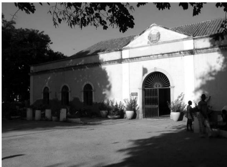
Илл. 2. Археологический музей, бывшая таможня, Бенгела, 2005 г.

существованием купцам того времени, которые собрали средства на его строительство. После обретения независимости в 1975 году в здании разместился национальный археологический музей. Была собрана команда техников, которая работала в общей сложности на 50 различных археологических объектах.