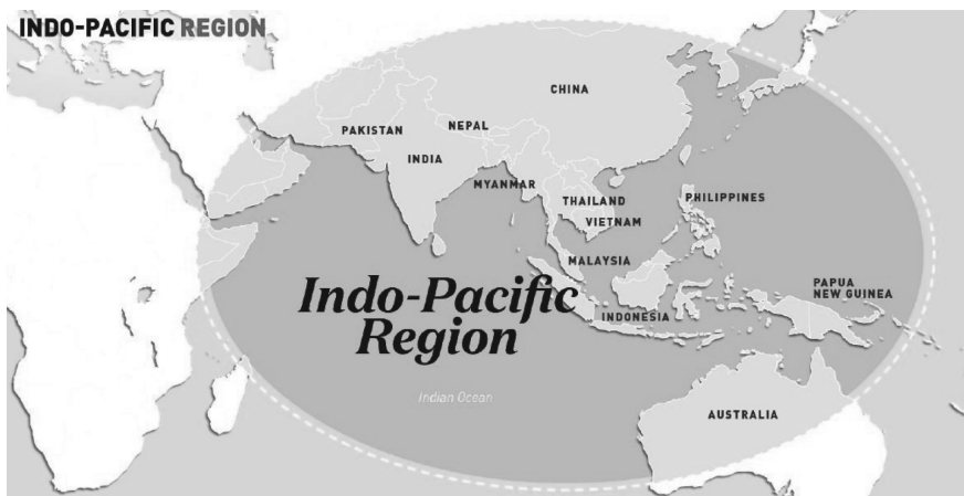
Рис. 2. Индо-Тихоокеанский регион

зу для США, особенно в данном регионе. Во-вторых, новое, что появилось в риторике руководителей США, — это заявления о Китае не только как о стране, меняющей баланс силы, но еще и как о стране, нарушающей международный порядок, построенный на правилах, которые создали и продвигают США и их союзники, пытаются отодвинуть ООН и нарушая тем самым международное право. В-третьих, согласно Индо-Тихоокеанской стратегии, США предполагают продвижение интеграции в регионе ( networked region ) под своим управлением, привлекая к этому проекту своих союзников и партнеров, предложив им разделить и расходы за обеспечение безопасности.