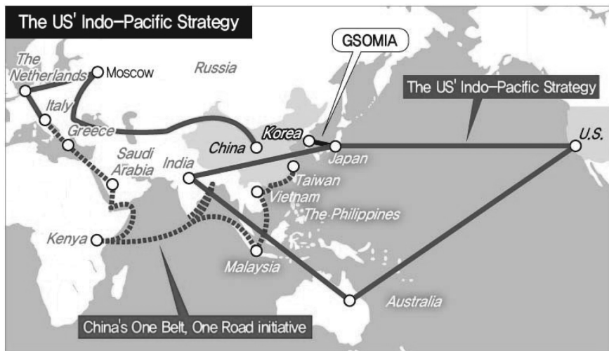
Рис. 3. Индо-Тихоокеанская стратегия США

Реализуя Индо-Тихоокеанскую стратегию, США опираются на свой военный потенциал. Глобальные интересы полностью проецируются и в Индо-АТР. В развитие этих интересов министерство обороны США сформулировало свое видение того, какие универсальные задачи оно должно решать в мире. В частности: