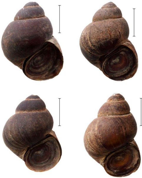
Рис. 1. Раковины Viviparus viviparus из р. Тура. Масштабная линейка 1 см.