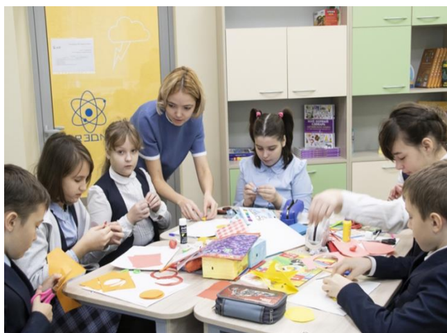
Рис. 2. Скрайбинг «аппликационный»

Скрайбинг «магнитный». Похож на аппликационный, единственное различие – готовые изображения крепятся магнитами на магнитную доску.