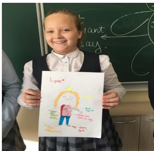
Рис. 1. Скрайбинг «ручной».

Ручной – классический скрининг, когда голос за кадром рассказывает информацию, рука в это время рисует изображения, иллюстрирующие устный рассказ. (см. рисунок 1). В данном скрайбинге используются, как правило, листы бумаги или презентационная доска, цветные карандаши, маркеры, фломастеры, кисти и краски, а также элементы аппликации.