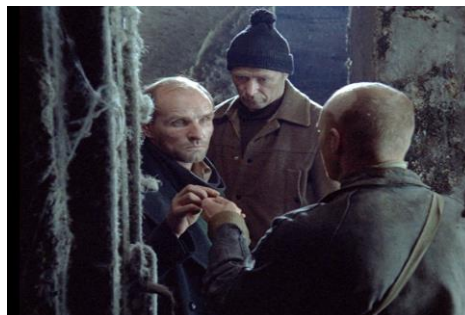
Рисунок 4 – Кадр из фильма «Сталкер»

На рис. 3 изображается ситуация, когда Сталкер ведет Профессора и Писателя к Комнате желаний, находящейся в «Зоне». В качестве образно воспринимаемого жребия здесь выступает перебинтованная гайка, которую бросает Сталкер для проверки безопасности места и выбора безопасного направления их пути к Комнате. На рис. 4 представлена ситуация принятия решения о том, кто первым пойдет в самое опасное и страшное место в «Зоне» – тоннель, который прозвали «мясорубка». В качестве жребия участники этой экспедиции тянут спички. Таким образом, в фильме осуществляется разная кинематографическая постановка фразеологизма бросать (метать, кидать, тянуть) жребий / жребий брошен , обеспечивающая разное развертывание кинометафоры и создающая эффект резонанса. Надо сказать, что поддержание и в известной мере усиление эффекта резонанса до-