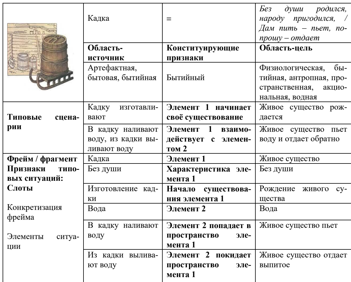
Таблица 2 – Фреймовый анализ загадки «Без души родился, народу пригодился, / Дам пить – пьет, попрошу – отдает»

В таблице представлена область-источник – артефактная, бытовая, бытийная; область-цель – физиологическая, бытийная, антропная, пространственная, акциональная, водная; и показаны конституирующие признаки, составляющие основу для кодирова-