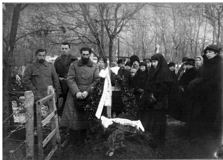
Похороны В.М. Пуришкевича.

К счастью, благодаря новым архивным находкам у нас есть возможность не довольствоваться субъективными воспоминаниями и полухудожественной литературой, а увидеть происходившее 13 января 1920 г. в Новороссийске своими глазами. Всеволод Пуришкевич отнюдь