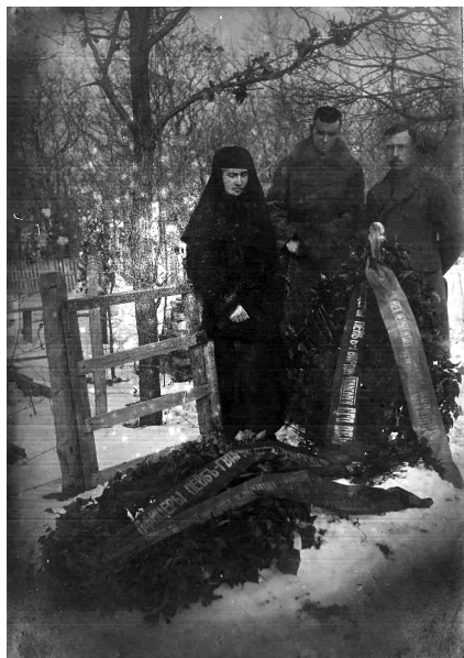
Могила В.М. Пуришкевича.