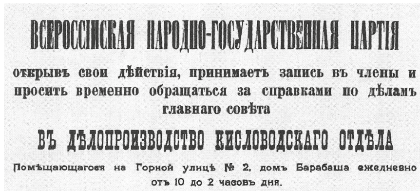
Фото 2. Объявление ВНГП (публикуется впервые)

в области Войска Донского 36 . В начале октября Пуришкевич вернулся в Ялту, где и оставался на протяжении следующего месяца. Помимо агитационного турне Пуришкевича ВНГП активно распространяла свой устав, который к августу был «отпечатан в громадном количестве экземпляров», и стремилась вербовать новых членов в армии 37 . По-видимому, определенные успехи в этом направлении имелись — так, более трети из числа присутствовавших на собрании группы ВНГП в Царицыне были военными (полковник, ротмистр, штабс-капитан, два поручика, прапорщик) 38 .