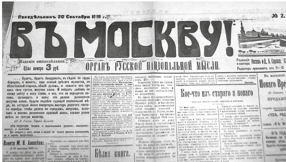
Фото 4. Газета «В Москву!»