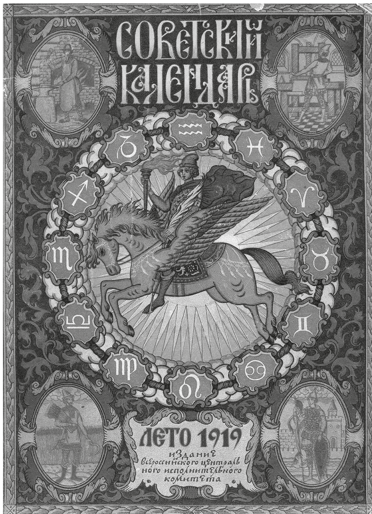
Титульный лист первого советского календаря (Советский календарь на 1919 год. М.: Издательство ВЦИК, 1918)

страницах советских отрывных календарей, а именно: выход первой русской книги (Апостол), казнь Стеньки Разина, Невская битва, Куликовская битва и др. 20