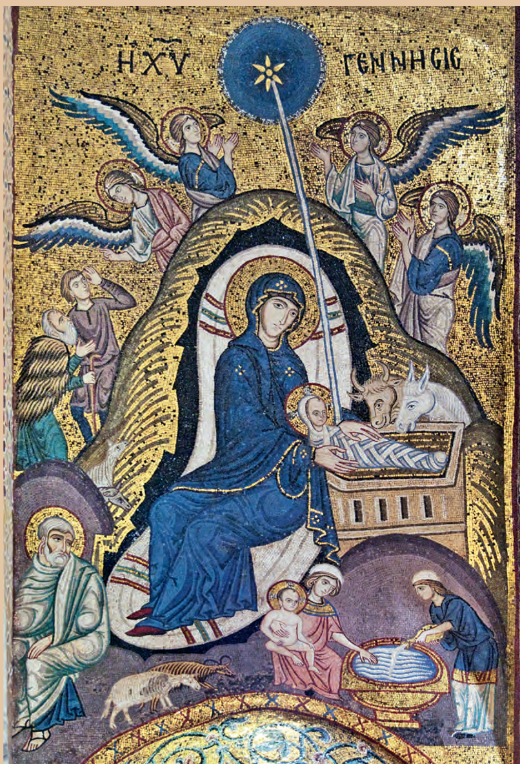
Рождество Христово. Мозаика церкви Санта-Мария-дель-Аммиральо в Палермо. 1146 — ок. 1151 г.