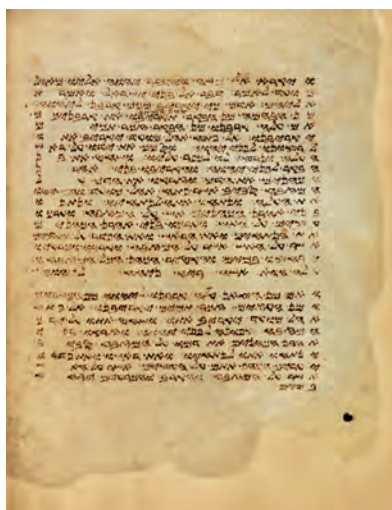
Начало кн. Левит.

Рукописи. Старейшие рукописи С. П. датируются XI–XIV вв. по Р. Х. К их числу относятся: Cantabr. Add.