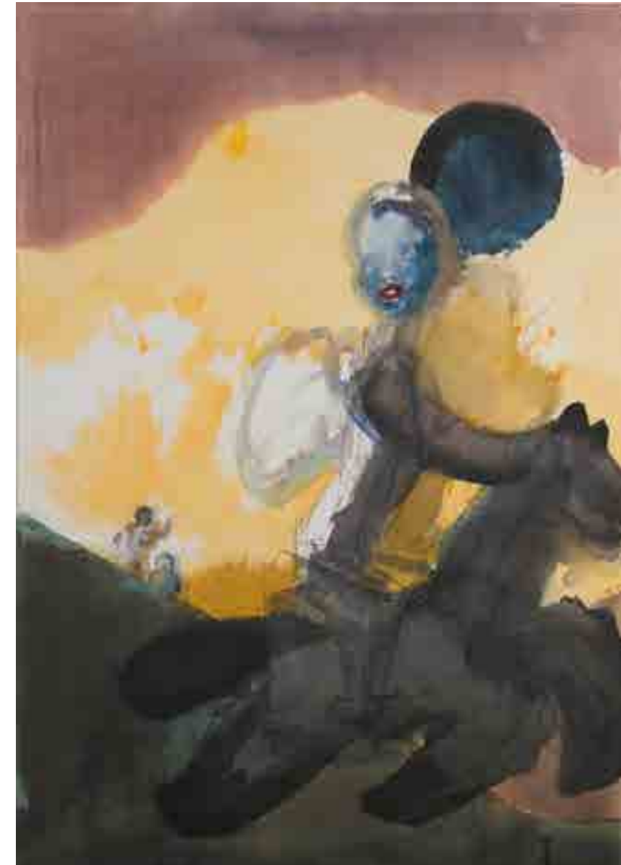
ЛЕОНИД ЦХЭ ВСАДНИК. 2020