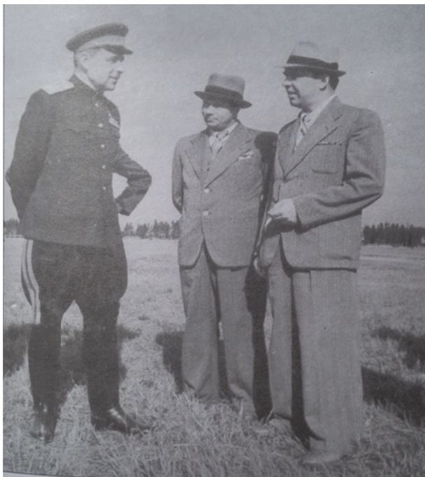
Рис. 5. Л.А. Говоров, Н.В. Соловьев, П.С. Попков. Ленинградская область. 1945 г. 72

ноблисполкома было вручено переходящее Красное знамя Совнаркома СССР 73 . Подробный анализ задач послевоенного восстановления и развития сельского хозяйства Ленинградской области Н.В. Соловьев представил в серии докладов 74 .