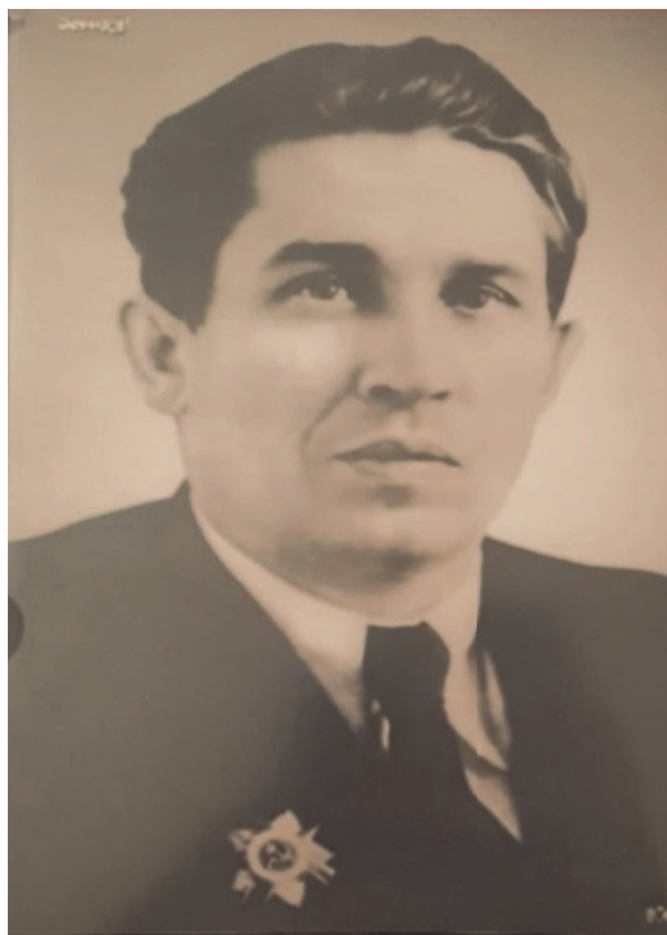
Рис. 8. И.С. Харитонов во второй половине 1940-х годов 99

Перед новыми главами Ленинградских городского и областного советов были поставлены задачи по руководству восстановлением народного хозяйства в рамках ут-