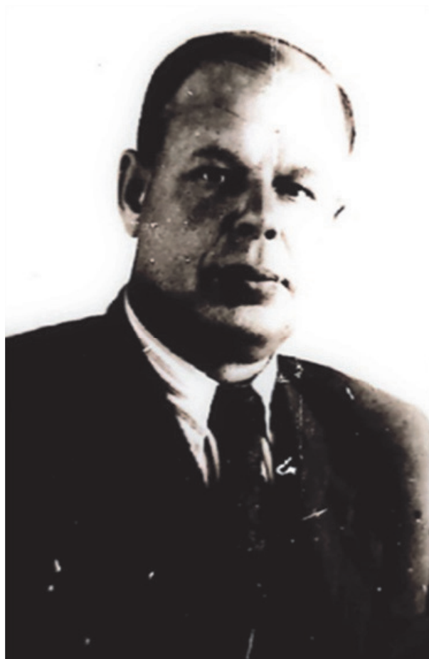
Рис. 9. Фото Кузнецова А.А.

Пост председателя Ленгориполкома в июне 1949 г. занял Андрей Алексеевич Кузнецов, пробывший в должности недолго – до июля 1950 г. 118 Сохранившиеся фотографии изображения А.А. Кузнецова позволяют заключить, что он был человеком уравновешенным, скрытным, ответственным, уверенным в своих силах (рис. 9).