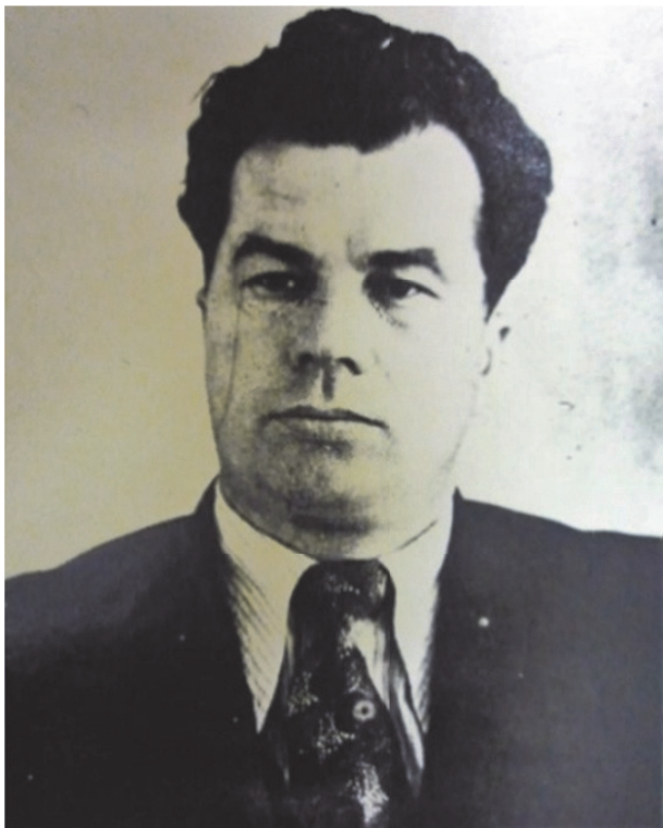
Рис. 7. Н.В. Соловьев. Фото из личного дела председателя Крымского областного комитета ВКП(б), 1946 г. 95

XVII пленуме Крымского областного комитета ВКП(б), состоявшемся 30-31 июля 1946 г. в Симферополе, он был избран первым секретарем Крымской партийной организации (рис. 7).