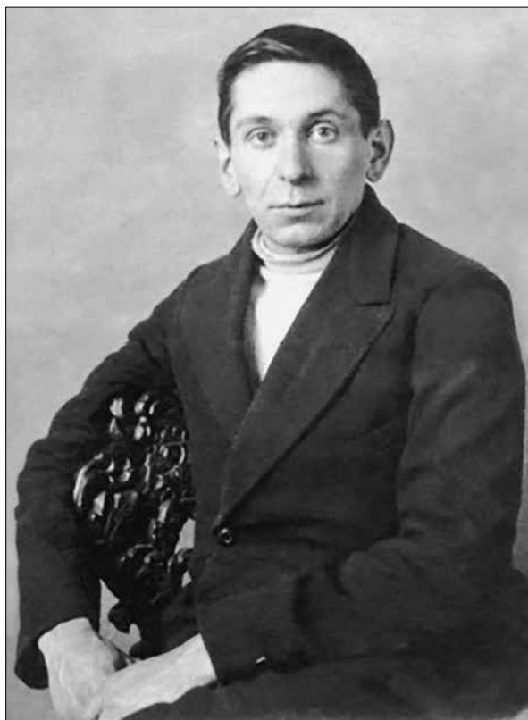
Боровка (Боровко) Григорий Иосифович (1894–1941), археолог, искусствовед