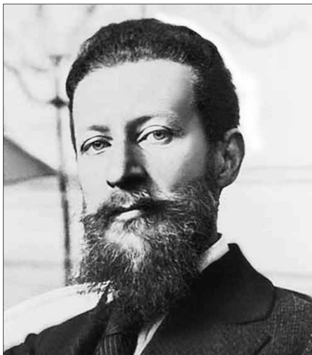
Тройницкий Сергей Николаевич (1882–1948), сотрудник Эрмитажа с 1908 г., директор в 1918 – мае 1927 г., искусствовед