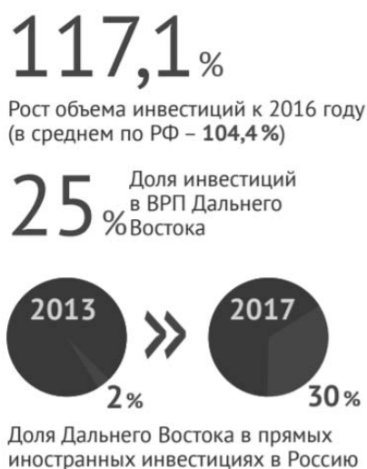
Рис. 1. Доля Дальнего Востока в прямых иностранных инвестициях в РФ в динамике пяти лет. Источник: Официальный бюллетень Минвостокразвития России. Документ подготовлен АНО «Агентство Дальнего Востока по привлечению инвестиций и поддержке экспорта».

На 2018 год данная тенденция сохранилась.[4] Данная информация была озвучена вице-премьером правительства РФ Юрием Трутневым. Он рассказал о том, что за пять лет доля Дальневосточного региона в отношении прямых зарубежных инвестиций, относительно всей