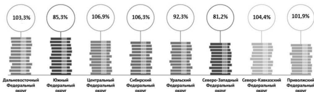
Рис. 2. Инвестиции в основной капитал по субъектам Российской Федерации в январе-декабре 2019 г. К 2018г. Данные предоставлены порталом Росстат.

территории РФ, приумножилась в несколько раз. Приведенный ниже рисунок демонстрирует, как изменялся объем инвестиций в Федеральные округа Российской Федерации с 2018 года по 2019 год, об этом свидетельствует рисунок 1. [9]