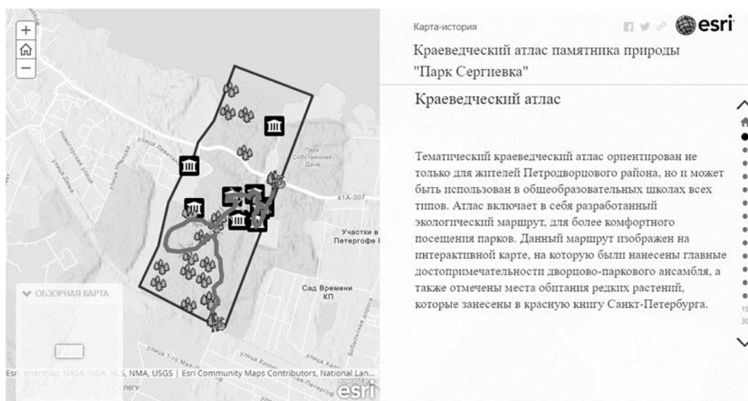
Рис.1 – Пример карты краеведческого атласа.

После проработки всех основных карт интерактивного атласа, был создан заключительный слой, на котором с помощью инструмента «линия» была нанесена экологическая тропа, которая объединяет все объекты между собой и в дальнейшем может служить в качестве эколого-просветительского маршрута.