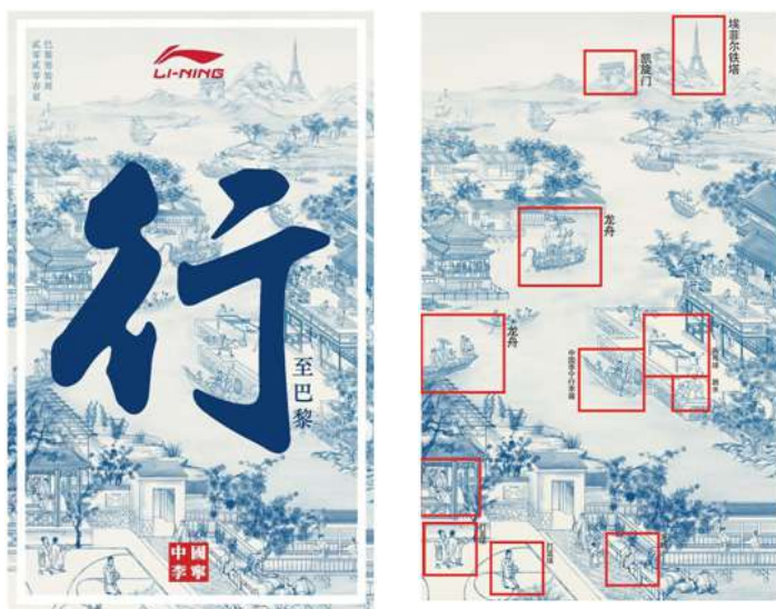
Рис. 2–3. Афиша бренда «Li-Ning».

моды в 2018 году вновь привлекла внимание потребителей к компании “Li Ning”. Основная тема афиши — «Путешествие в Париж». На афише представлены элементы китайского спорта и культуры в виде рисунков тушью. Афиша выполнена в сине-белой гамме. Особое внимание привлекает иероглиф “行”, который занимает всю афишу и выражает ее основную тему. Красные логотипы бренда, расположенные в верхней и нижней частях афиши, образуют яркий контраст с синим фоном афиши. Интересным моментом является стремление дизайнера объединить элементы традиционной китайской культуры с достопримечательностями Парижа. Мы можем увидеть на афише катание на драконьей лодке, баскетбол, настольный теннис, дайвинг, а также Триумфальную арку и Эйфелеву башню.