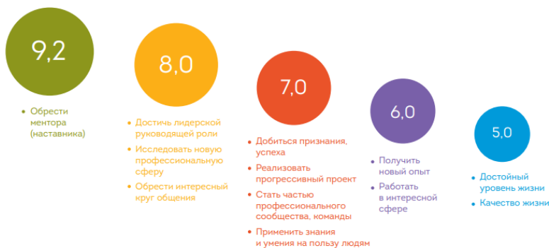
Рисунок 3. Распределение ответов на вопрос: «Что бы Вы хотели достичь в Вашей работе, карьере в целом?» (N = 1000)

Таким образом, построение стратегии карьеры в современном мире является необходимым навыком, оно помогает молодым людям на начальном этапе определиться с будущей профессией, добиваться быстрого карьерного роста и успеха, а в долгосрочной перспективе позволяет использовать сильные стороны, нивелировать слабые стороны. Тем самым, способствует эффективному распределению человеческих ресурсов и повышает производительность труда.