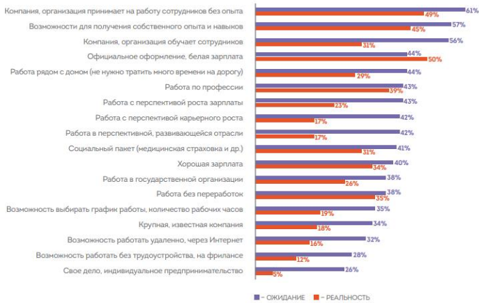
Рисунок 1. Распределение ответов на вопросы: 1) «Отметьте, какие из следующих характеристик наилучшим образом описывают Ваше ИДЕАЛЬНОЕ первое место работы!» (N = 1000); 2) «Отметьте, какие из следующих характеристики наилучшим образом описывают Ваше первое место работы!» (N = 110)

Даже на постоянном месте работы официальное оформление и «белую» зарплату получают лишь 57% молодых людей, по профессии работают лишь 45%, считают свою зарплату хорошей 42%, только 35% работают в крупной компании. Несмотря на развитие цифровых технологий и новых форм занятости, только 18% молодых людей отметили, что имеют возможность выбирать график работы. Лишь 10% могут работать удаленно через Интернет, при этом хотели бы иметь такую возможность около половины молодых людей (45%). Большинство молодых людей хотели бы открыть свое дело (72%), но пока всего 10% реализовывают это желание.