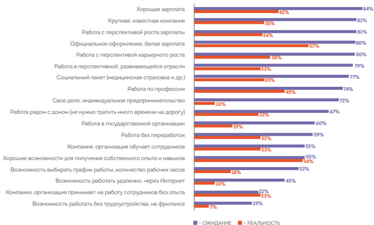
Рисунок 2. Распределение ответов на вопросы: 1) «Отметьте, какие из следующих характеристик наилучшим образом описывают Ваше ИДЕАЛЬНОЕ постоянное место работы». (N = 1000); 2) «Отметьте, какие из следующих характеристик наилучшим образом описывают Ваше постоянное место работы». (N = 239)

Важнейшей потребностью молодежи при построении карьеры является обретение ментора (наставника). В ответах на вопрос, чего молодые люди хотели бы достичь в работе, карьере в целом, на первом месте – именно потребность в наставнике. Следующие по важности цели карьеры – достичь лидерской роли и исследовать новую профессиональную сферу. 1