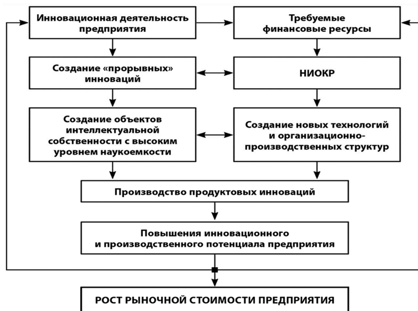
Рисунок 2 – Увеличение капитализации предприятия за счет инновационной деятельности

На сегодняшний день наибольшим инновационным потенциалом обладают крупные компании, так как малые предприятия не обладают ресурсами для самостоятельной реализации инновационной деятельности. Инновационная сфера страны в целом складывается из инновационной деятельности каждого отдельного предприятия, однако существует ряд причин, препятствующих ее эффективной реализации.