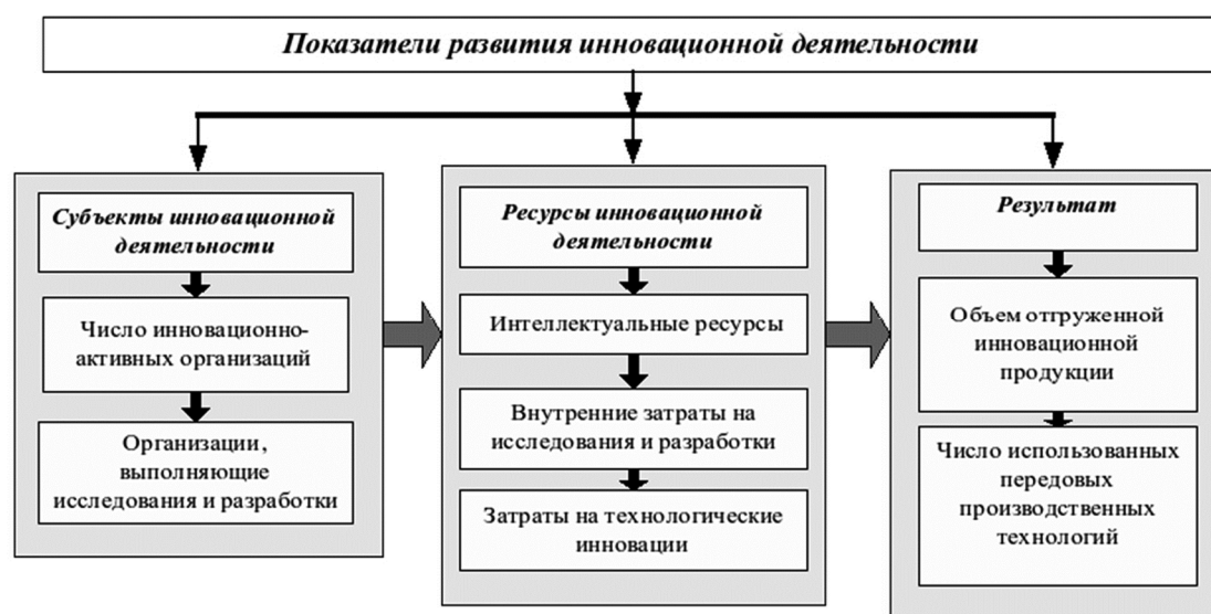
Рисунок 1 – Показатели развития инновационной деятельности