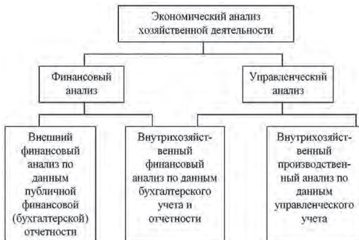
Рисунок 1 – Экономический анализ хозяйственной деятельности

На сегодняшний день, описание целостной экономической «картины» предприятия невозможно без финансового и управленческого анализа. Вопросы финансового и управленческого анализа взаимосвязаны при обосновании бизнес-планов, а также в системе маркетинга, т.е. в системе управления производством и реализацией продукции, работ и услуг, ориентированной на рынок.