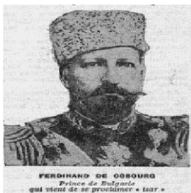
Илл. 5. Фотография Фердинанда I из журнала “L’humanite” от 05.10.1905