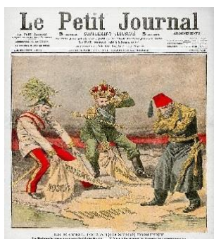
Илл. 1. Первая страница “Le Petit Journal” от 05.10.1908