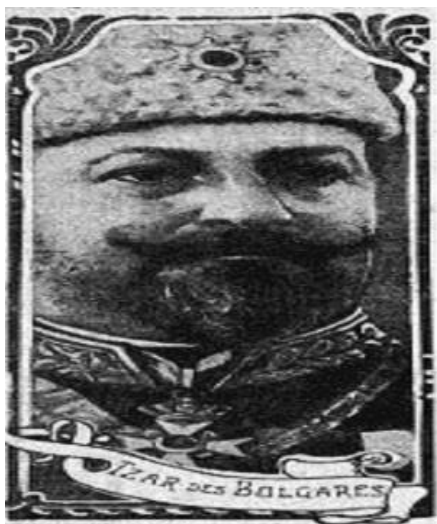
Илл. 9. Фотография Фердинанда I из журнала “Le Matin” от 05.10.1908