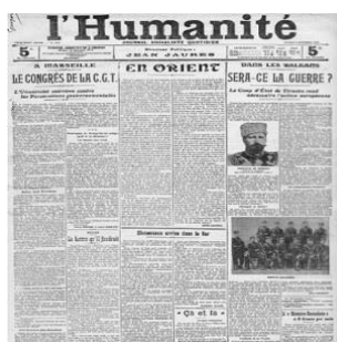
Илл. 4. Первая страница журнала “L’humanite” от 05.10.1905