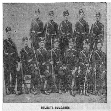
Илл. 6. Болгарские солдаты из “L’humanite” от 05.10.1905