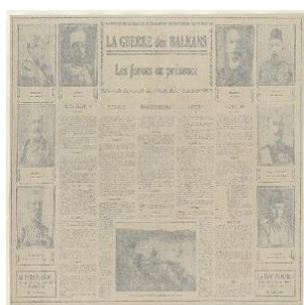
Илл. 3. Страница журнала “LePetit Parissen”