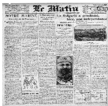
Илл. 7. Первая страница журнала “Le Matin” от 05.10.1908