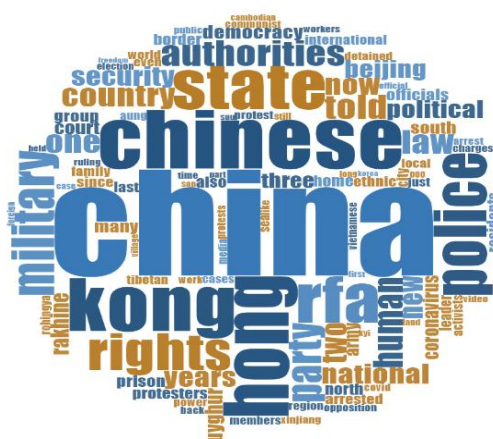
Рис.2. Ключевые слова публикаций американского новостного ресурса «Радио Свободная Азия» в социальной сети Twitter

Сдерживание Пекина от влияния на аудиторию азиатских стран осуществляется посредством распространения проамериканской информации через интернет-проекты и каналы международного вещания («Радио Свободная Азия», «Голос Америки»). В 2020 г. Агентство США по глобальным медиа (U.S. Agency for Global Media), руководящее американским инновационным вещанием, получило рекордные 810 млн долл. финансирования [16, с. 244]. Критика китайской политики в области прав человека, религиозных свобод и иных аспектов внутренней и внешней политики – основной контент подобных ресурсов, что официально закреплено в отчетах Агентства по глобальным медиа [19, с. 28]. Анализ англоязычного аккаунта «Радио Свободная Азия» в социальной сети Twitter демонстрирует, что в новостной повестке дня отсутствуют новости о США, в то время как Китай (описываемый в негативном ключе) занимает приоритетную позицию. Ключевыми в публикациях являются слова «China», «Chinese», «Hong Kong», «Military», «Police», «Human Rights» и др. (см. Рис. 2.)