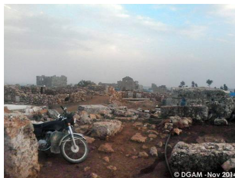
Поселения беженцев на территории деревни Шиншарах, Джабаль Завия

По результатам исследования спутниковых снимков, предоставленных ЮНИТАР/ЮНОСАТ, за декабрь 2014 г. были выявлены факты строительства стены длиной 135 м в Шиншархе, несколько участков, поврежденных раскопками, а также около 80 новых построек среди руин. На снимках видны 29 жилых построек, расположенных в Рабии, и 22 постройки, расположенные в Серджилле [13].