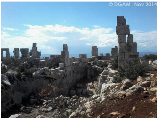
Вандализованные руины деревни Кафр-Акаб, Джабал Вастани, 2014 г.

под контролем курдских сил, а после начала операции «Оливковая ветвь» в январе 2018 г. она (в составе самопровозглашенного кантона Африн) была оккупирована вооруженными силами Турции и протурецкими вооруженными формированиями. Южная часть Древних деревень попал под контроль вооруженной оппозиции.