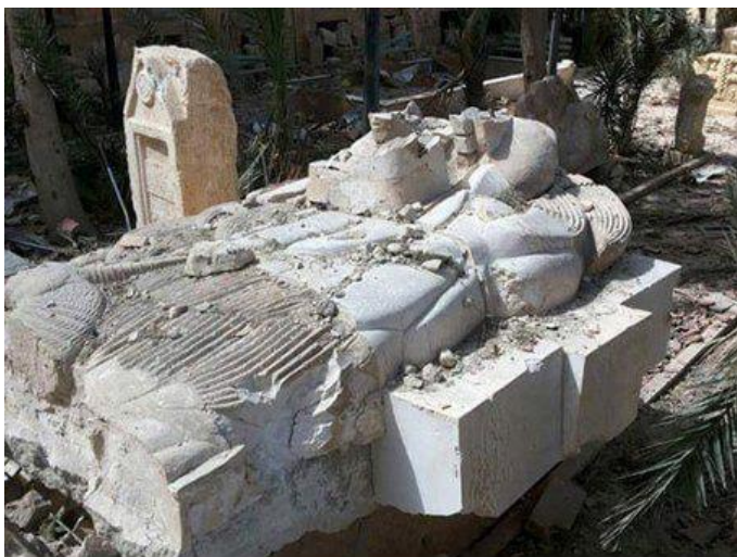
Разрушенная статуя льва Аллата