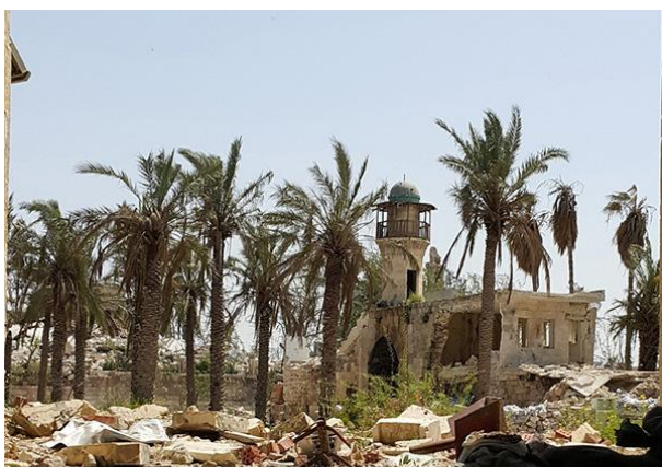
Разрушенная мечеть ас-Сультани в Алеппо

Генеральный Директор ЮНЕСКО Ирина Бокова в обращении к сторонам вооруженного конфликта в Сирийской Арабской Республике от 30 июля 2012г. призывала стороны вооруженного конфликта не использовать объекты, представляющие историческую или культурную ценность, в военных целях. Особенную обеспокоенность генеральный директор выразила по отношению к старому городу Алеппо, который из-за своего стратегического значения может стать местом ожесточенных боев [17].