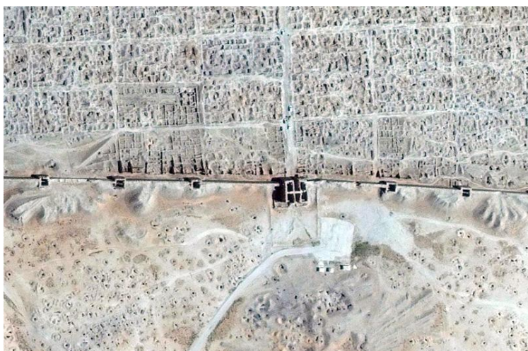
Спутниковое изображения следов грабительских раскопок на памятнике Дура Еропос

ASOR является не единственным проектом, фиксирующим при помощи спутников существующий ущерб. Программа оперативных спутниковых применений Научно-исследовательского института Организации Объединенных Наций (UNITAR's UNOSAT) создана для сбора и анализа спутниковых снимков для мониторинга информации о гуманитарной обстановке в кризисных регионах. В докладе