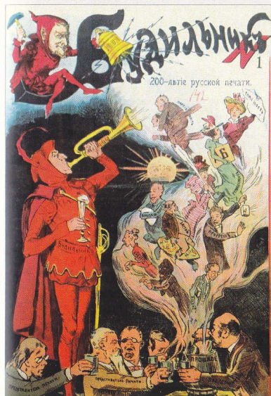
Будильник. 1903. № 1