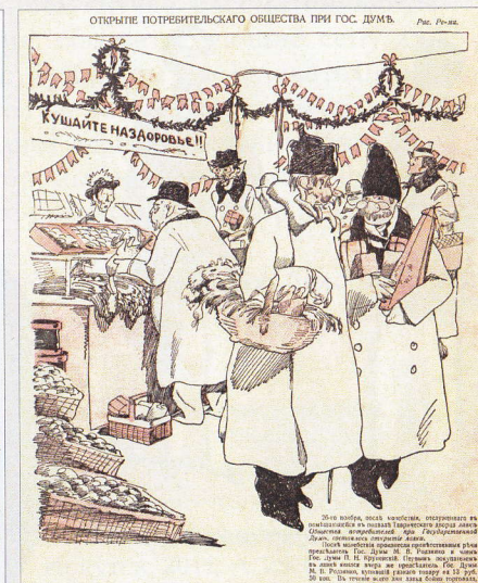
Новый сатирикон. 1915. № 50.