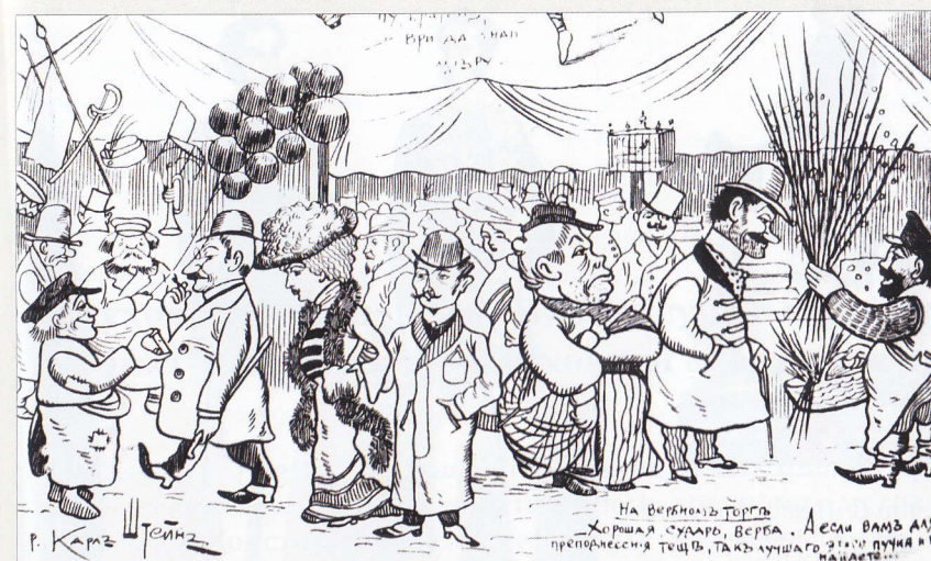
Наше время. 1903. № 13.