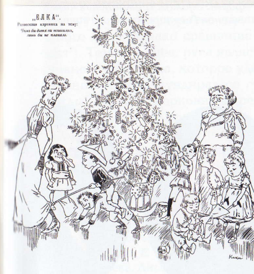
Шут. 1897. № 52.