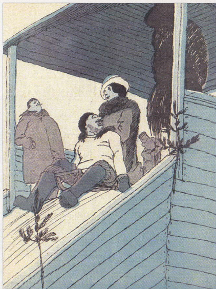
Сатирикон. 1911. № 3. 15 янв. С.12