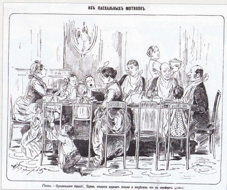
Шут. 1883. № 16.