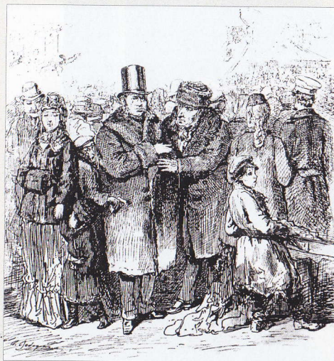
Стрекоза. 1878. № 9.