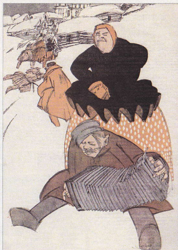
△ Сатирикон. 1913. № 11. 15 марта. С.8.