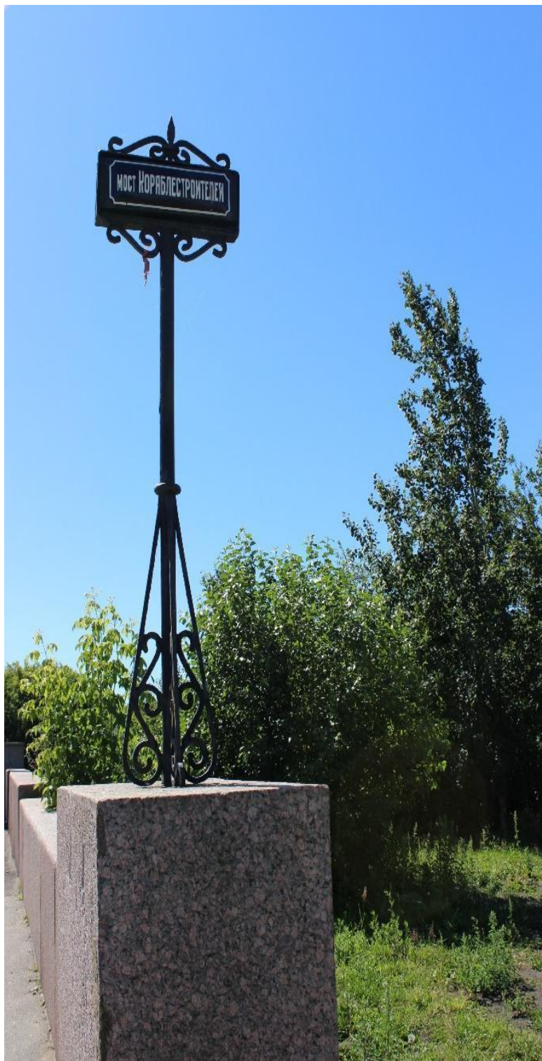
Иллюстрация 7. Указатель «Мост Кораблестроителей». 2002 г.