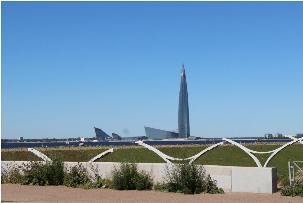
Иллюстрация 12. Башня и плато: вид на Лахта-центр со стороны устья Смоленки. 2020 г.

Небесная линия, водная линия в этой паре служат фоном, в то время как игла, шпиль, купол становятся в нем событиями. Башня и плато — вот та эмблематическая формула, которая раскрывает своеобразие петербургского ландшафта (Степанов, 2016, стр. 224-237). Для устья Смоленки в его современном виде вертикалью, определяющей характер пространства, стали не высотные жилые дома, возведенные в некотором отступе от реки, а маячащая в кадре залива, высящаяся над распластанным горизонтом башня Лахта-центра, своими масштабами и иллюзорной деструкцией соотношений «близкое-далекое» создающая оптическое преодоление, сокращение расстояния, что еще больше подчеркивает фантастичность и безлюдность этого нового видового ракурса города ( Илл. 12 ).