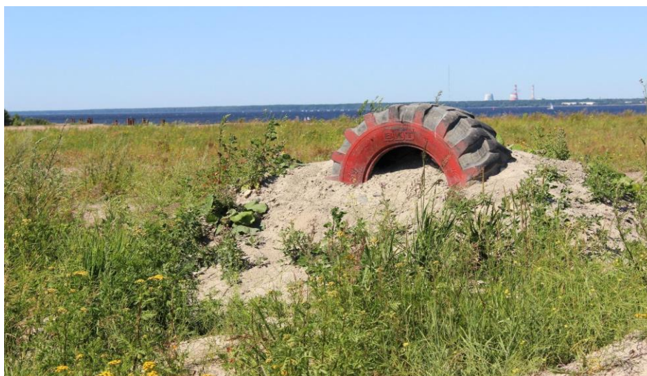
Иллюстрация 5. Территория вблизи устья Смоленки. Шина. 2020 г.