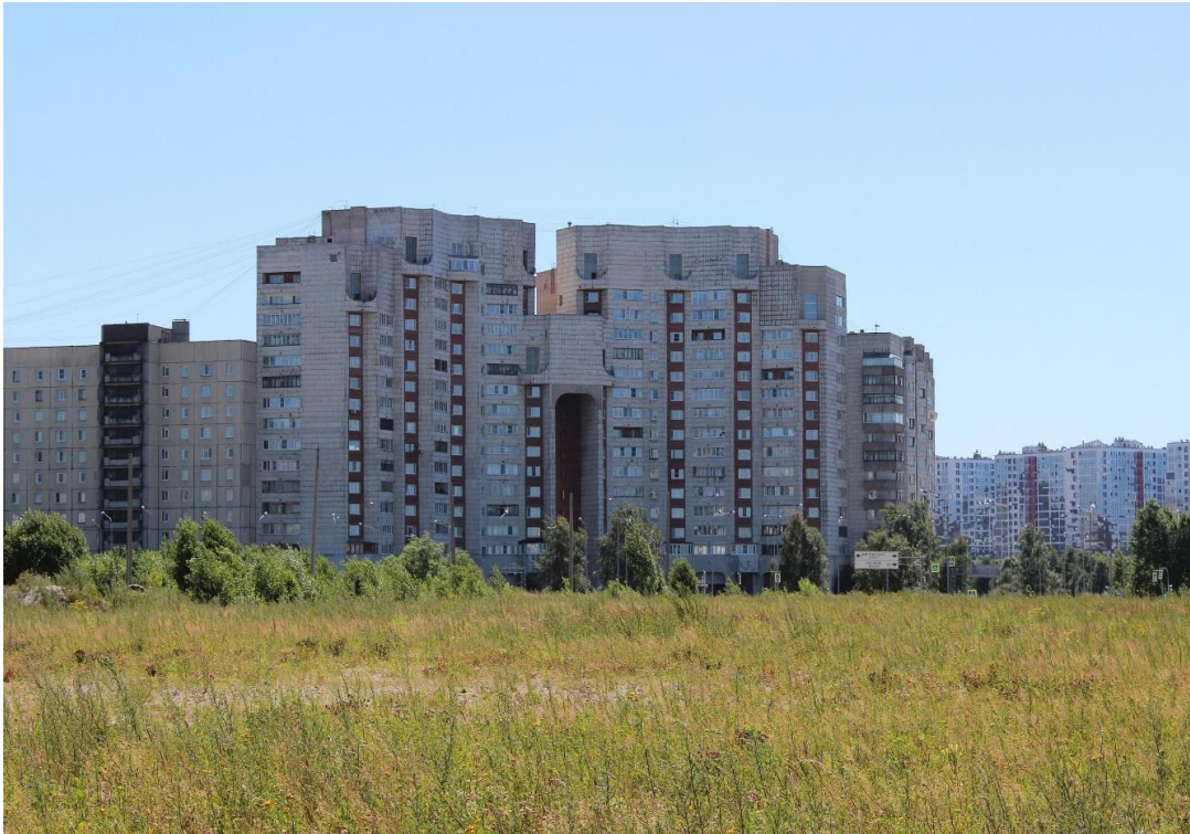
Иллюстрация 3. Дом на углу Капитанской улицы и Морской набережной. 2020 г.