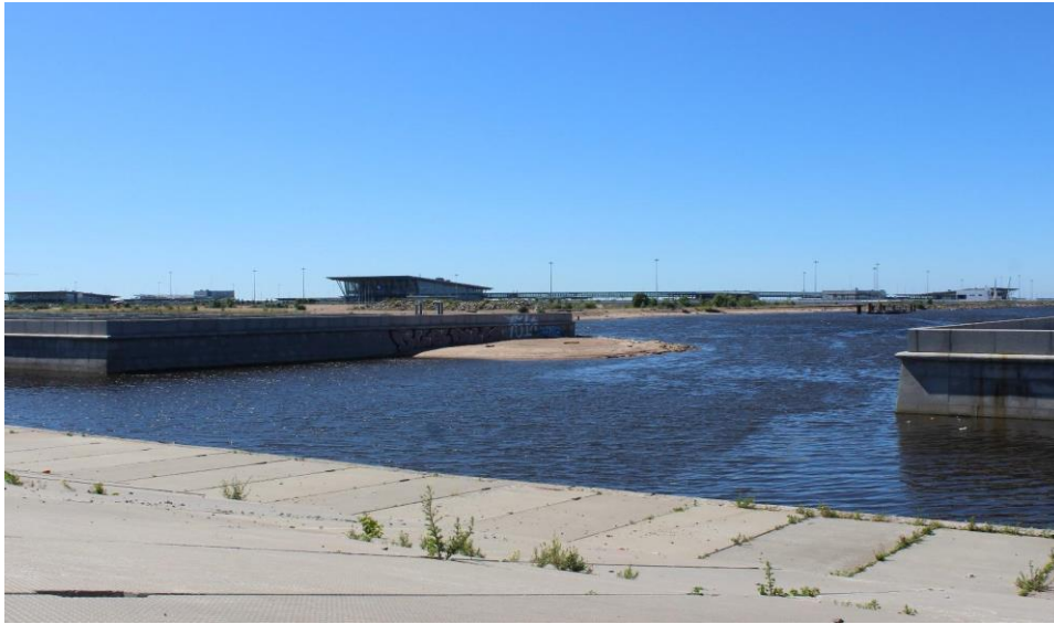
Иллюстрация 6. Границы неба, земли и воды и международная граница, маркированная зданиями морского пассажирского порта. 2020 г.

Пространственные ощущения дополняются четко воспроизведенной картиной края города (окраины), что, в общем, близко к истине — здесь находится одна из западных точек города, за которой начинается море. Территория устья Смоленки оказывается пересечена разнообразными границами: временные границы освоения этой местности, граница между водой и небом, заливом и сушей, речная граница между Васильевским островом и островом Декабристов, и, наконец, разрыв Морской набережной, на этом участке лишенной сквозного проезда, а потому как бы отсутствующей, стертой. К этим границам добавляется и граница государственная, институционально оформленная как таможенная зона Морского пассажирского порта 1 , отделенного от пустынного, неосвоенного пространства намывного берега заборами и колючей проволокой. Возможно ли безмятежное обитание в этой пограничной территории, среди и поверх границ? Вероятно, возможно, поскольку она вторит общей пограничности Петербурга, места встречи России и Европы, возникшего на стыке эпох (Илл. 5-6) Старая часть Смоленки тоже представляет собою своеобразную границу: между промышленным кварталом (сейчас, скорее, бизнес-кварталом) и жилым, и, поскольку река Смоленка, по сути, — кладбищенский ручей, — между лютеранским и православным кладбища-