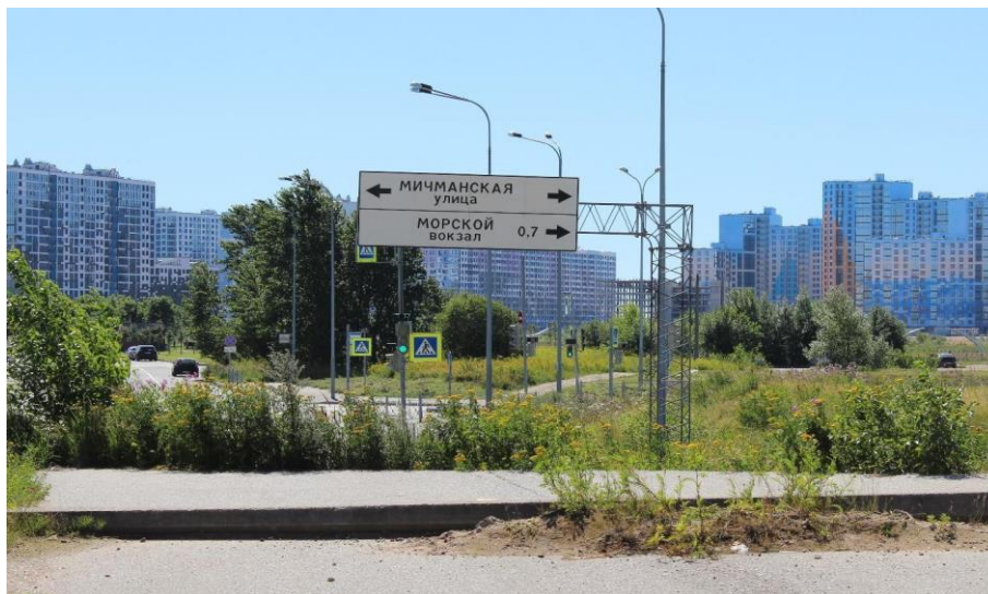
Иллюстрация 9. Дорожный указатель на углу Мичманской улицы и Морской набережной. 2020 г.

Меты иного рода вносят граффити, распространяющиеся по всем доступным поверхностям как некие знаки присутствия. Освоение не-места с помощью графических практик — способ телесного переживания пространства, существующего за пределами повседневной реальности (например, длинные ленты граффити, разворачивающиеся на стенах заборов и гаражей вдоль железнодорожных путей, их можно увидеть, как правило, лишь из окна вагона). Помимо тегов, бабблов, рисунков, здесь встречаются и вполне лаконично оформленные сообщения, где содержательная часть доминирует над стилистической. Они гласят: «Россия живет скоростями», «Борись за метамодерн!»