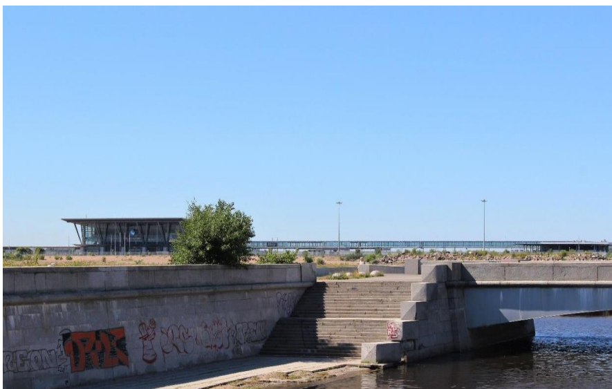
Иллюстрация 14. Гранитное обрамление устья Смоленки. 2020 г.