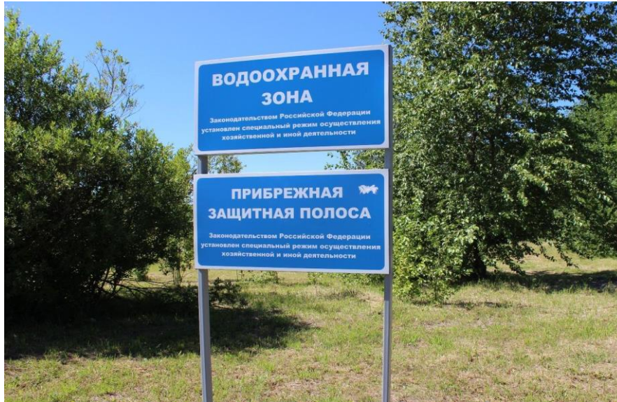
Иллюстрация 8. Информационный щит вблизи устья Смоленки. 2020 г.