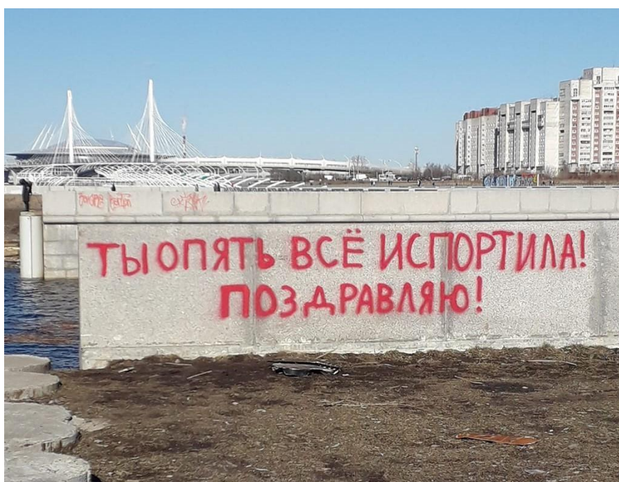
Иллюстрация 10. Граффити на гранитной облицовке набережной Смоленки. 2020 г.

или фиксируют совсем наивные выплески индивидуального, частного: « Вся моя жизнь — это пазлы. Ветром раздует фрагменты... » или отчаянное « Поздравляю! Ты опять всё испортила » (Илл.10). Концептуальность последнего заявления заключается в признании самого процесса вандального нанесения краски на гранитную облицовку. Своего рода интервенция конкретного, личного, закрепленного манифестационным высказыванием, в безличное пространство не-места может неприятно удивлять, шокировать, но благодаря ей транзитное состояние прерывается, обнаруживая в месте разлома одно из городских сообществ. В силу своей неопределенной, слоистой идентичности городские пустоты притягивают уличных художников, чье творчество не столько преобразует пустые пространства, сколько вносит завершающие штрихи к их образу