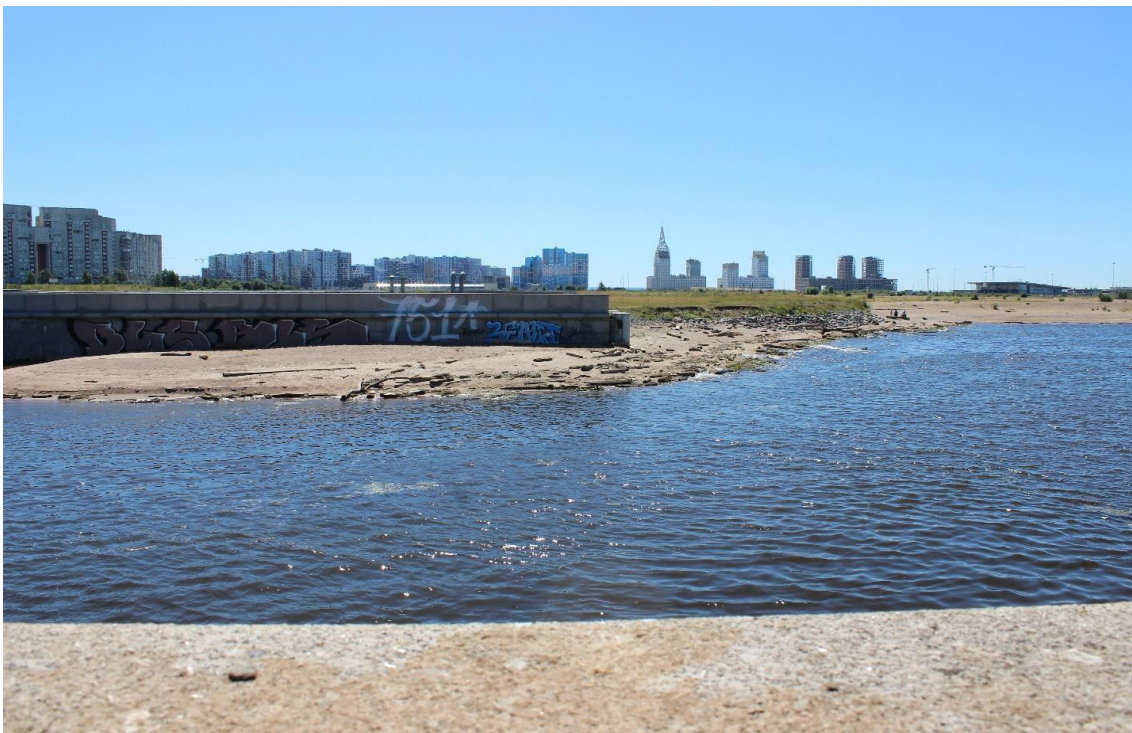
Иллюстрация 1. Устье р. Смоленки с видом на новые намывные территории. 2020.

участвующих в формировании идентичности, дополняют, а порой и заменяют, данные исторических исследований, вызванных «интересом публики к старине, как будто историки рассказывают нашим современникам о том, кто они такие, через рассказ о тех, кем они больше не являются» (Оже, 2017, стр. 31). В поиске «ускользающей идентичности» отчасти состоит практическая роль популярного краеведения, подпитывающего «культ корней ( roots ) и развитие генеалогических изысканий» (Нора, 2005, стр. 202). Для одних пустынные или заброшенные участки («заброшки» 1 ) становятся ценностно значимыми в силу этих исторических связей и личностных принадлежностей, в то время как для других они представляют скрытую угрозу хаоса или же возможности преобразования и создания новых культурных смыслов, никак не согласующихся со старыми. Эти возможности, таящиеся в пустотах, определяются существованием или отсутствием памяти места, ее сохранением или преодолением, что обуславливает соотношение истории и идентичности в связи с отдельно рассматриваемым фрагментом городского пространства.