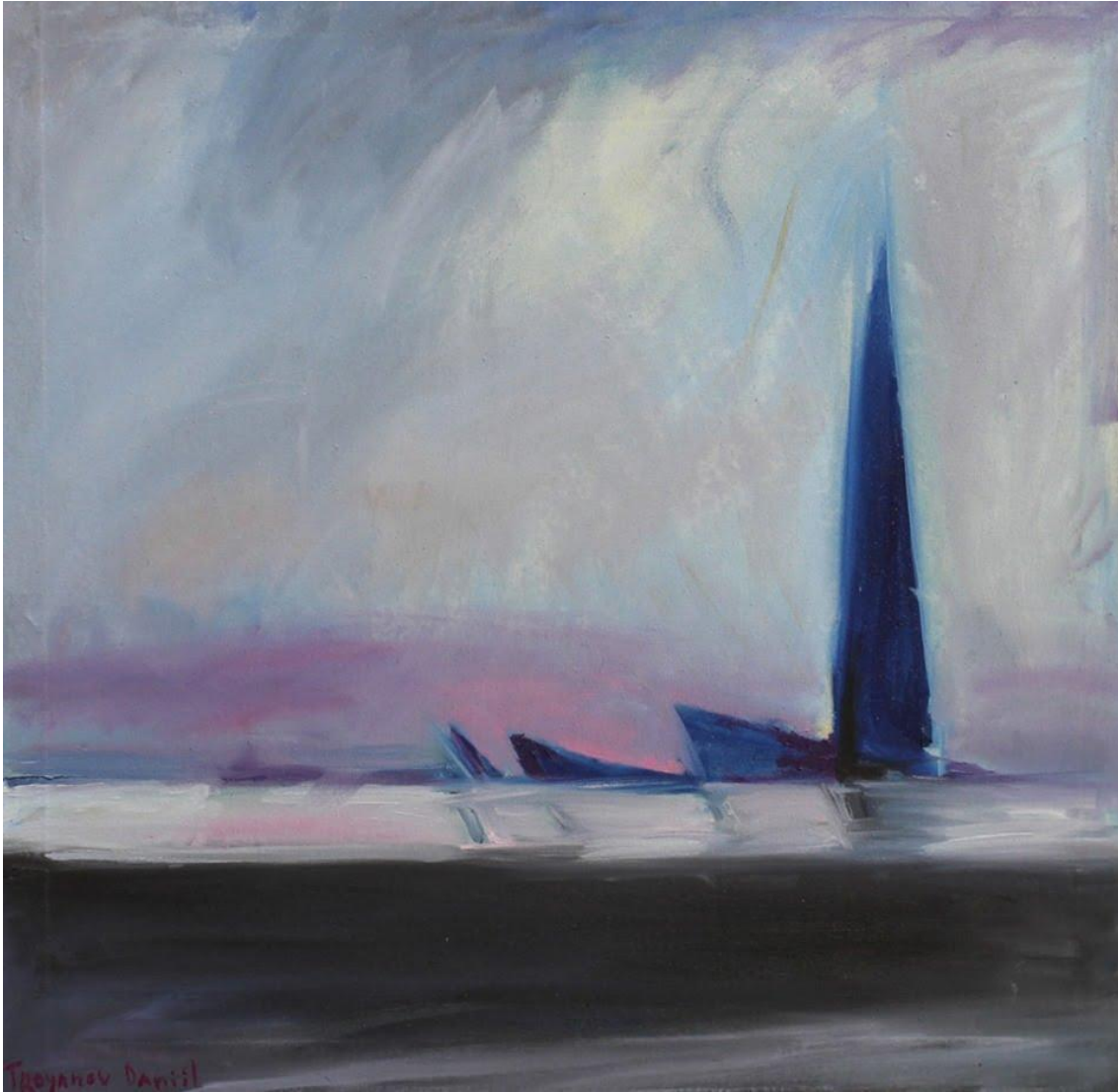
Иллюстрация 13. Д. Троянов. Лахта. 2020. 80x80 см. Холст, масло.

стынности дополняет образ города без человека, города, несоизмеренного человеку, — ведет к появлению в иконографии петербургского ландшафта новых видов, открывающихся от устья Смоленки (Илл. 13).