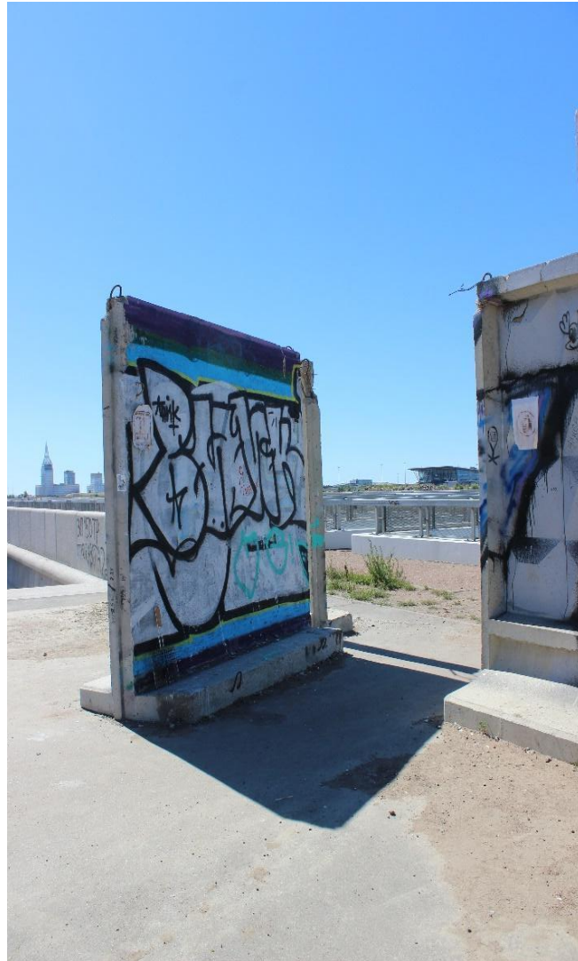
Иллюстрация 11. Плиты забора, отделяющего территорию Устья Смоленки от пляжа Финского залива. 2020 г.

кой на пути следования. Как и многие другие поверхности в этом не-месте , забор уже освоен граффитистами ( Илл.11 ) Местные стены стали привычной площадкой для уличного искусства, прибежищем творческих проявлений, в которых реализуется практика высвобождения скрытого или подавленного художественного желания 1 .