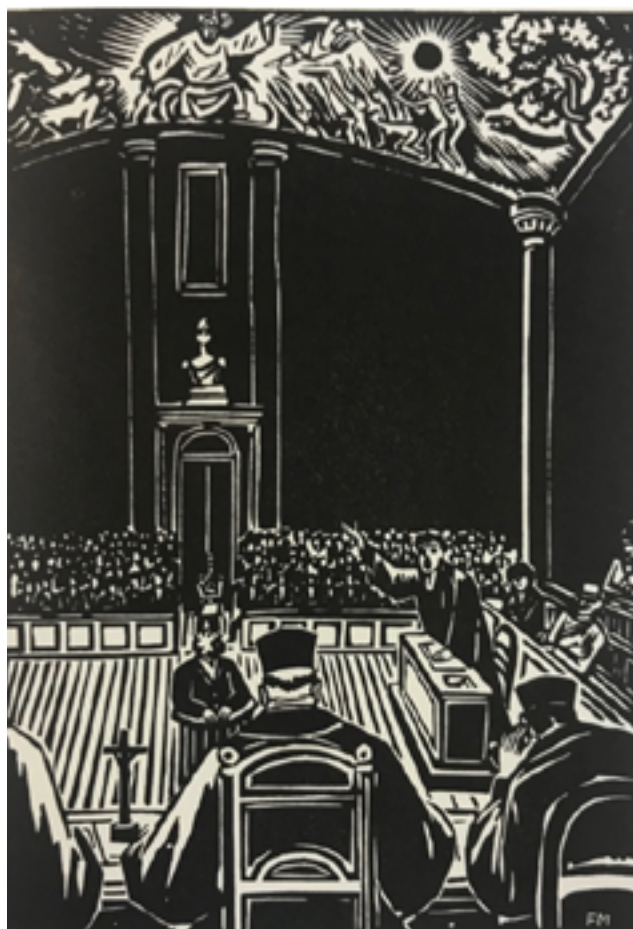
Илл. 4. воспроизводится по изданию Masereel, F. Die Stadt: 100 Holzchnitte. – Berlin: Verlag Rütten&Loening, 1961 [год первого издания 1925] pp. 7-8