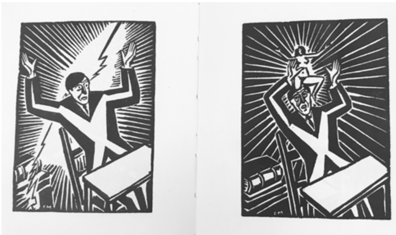
Илл. 2. Воспроизводится по изданию Masereel F. Die Idée: 85 Holzchnitte – Zürich: Im Insel-Verlag, 1959 [год первого издания 1920] – pp. 3 - 4

Помимо этого, важное место занимает и проблема формальных средств визуализации движения. Часто Мазерель показывает фигуру человека в неустойчивой позе: в беге, прыжке, идущим куда-то. Важную роль играет и язык тела или просто жесты, иногда довольно нарочитые: герои могут махнуть рукой на что-то, выражая пренебрежение, пожимают плечами, разводят руками и т.д. Иногда, аспект движения вносится за счет построения композиции. Например, даже если герой находится в устойчивой позе, например, сидит за столом, художник строит композицию под углом, что добавляет динамику. Яркий пример листы из романа «Идея» («Idée», 1920), где художник изображает сцену рождения идеи. Главный герой сидит за столом, но композиция построена диагонально, мебель – стол и стул, выглядят маленькими и непрочными, сам герой сидит раскинув руки, будто бы готовый упасть (Илл. 2). Все эти приемы