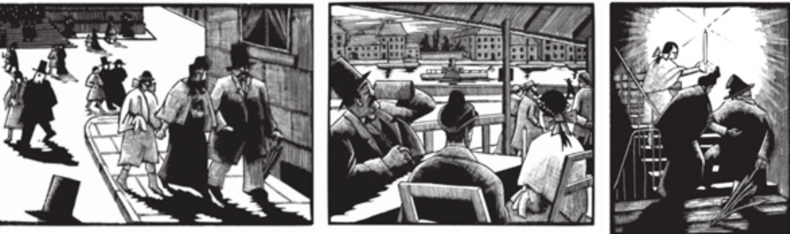
Илл. 3. воспроизводится по изданию Nüchel O. Destiny. Novel In Pictures – Mineola, New York: Dover Publications Inc, 2007 [год первого издания 1926] pp. 12-14