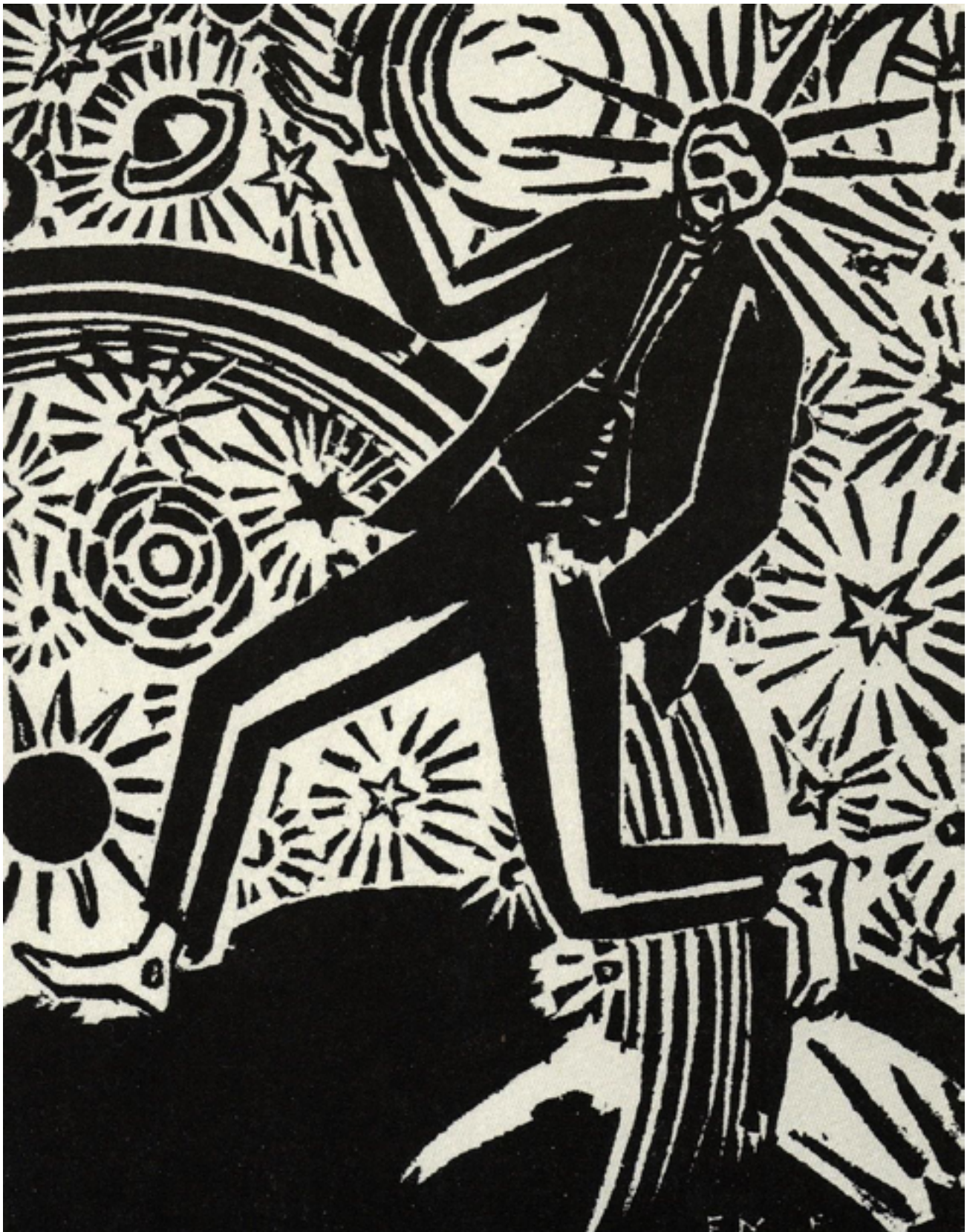
Илл. 1. воспроизводится по изданию Masereel. F. Mein Stundenbuch: 165 Holzchnitte. – Munich: Kurt Wolff, 1928 [год первого издания 1919] – р. 164

отсылки, именно американское название гораздо более ярко отражает их характер. Дело в том, что все произведения Мазереля остро социально ориентированы, наполнены критикой политической и общественной ситуации, и художник часто придает борьбе героя с системой оттенок мученичества, насыщая произведение христианскими символами, обращениями к христианской иконографии и другими религиозными параллелями. Однако, в