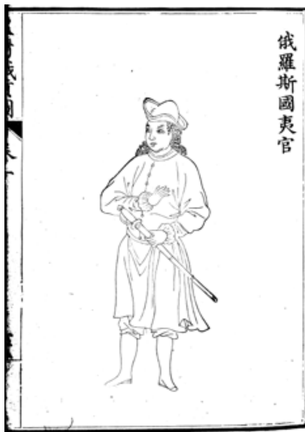
Рис.1-2. Россияне. Рисунок из ксилографа «Изображения данников правящей династии Цин» («Хуан Цин чжи гун ту»). XVIII в. Место хранения: Восточный отдел Научной библиотеки им. М. Горького СПбГУ, шифр Хул. 348.