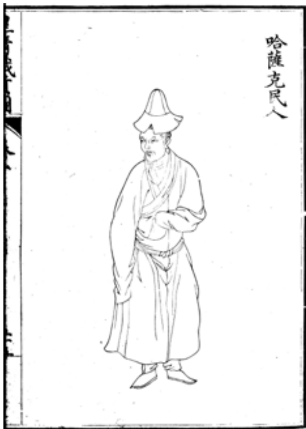
Рис.3. Казах. Рисунок из ксилографа «Изображения данников правящей династии Цин» («Хуан Цин чжи гун ту»). XVIII в. Место хранения: Восточный отдел Научной библиотеки им. М. Горького СПбГУ, шифр Хул. 348.

Благая сила дэ, ниспосланная Небом на Землю через посредство Сына Неба, была призвана облагородить не только ханьцев, но и «варваров четырех сторон света» в целях установления идеального порядка в Поднебесной. В данном контексте император выступал в качестве универсального устроителя «мира-социума», преобразующего как Срединное государство, так и «варварскую периферию». Из этого, в свою очередь, проистекала настоятельная необходимость постоянного и пристального внимания к соблюдению должного порядка и гармонии в отношениях между зоной высокой цивилизации (Китаем) и «варварами», а