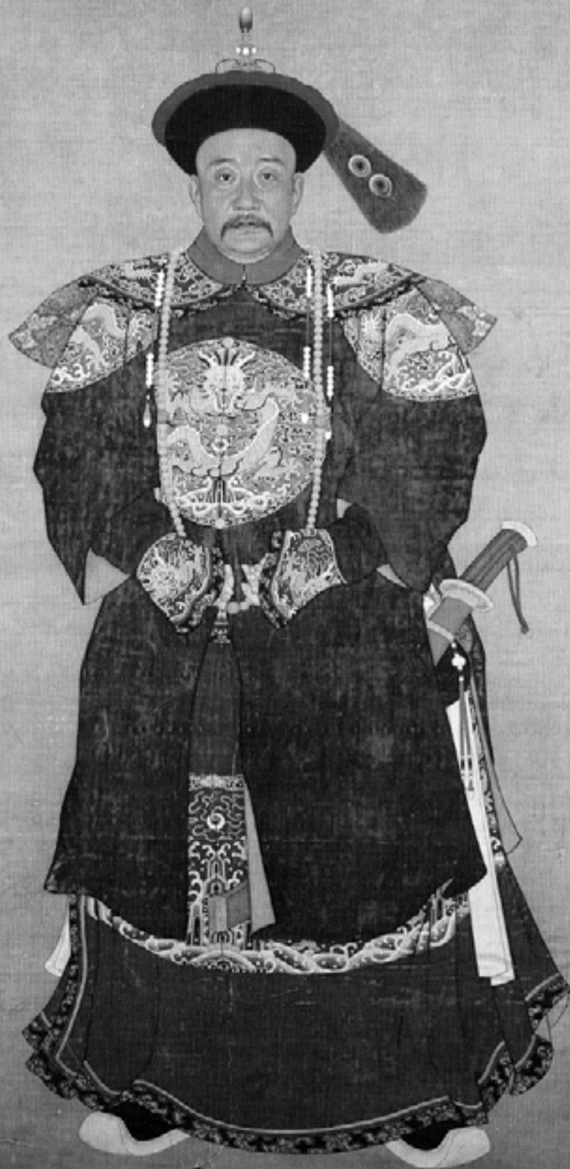
Портрет Фухэна (ок. 1760 года). Коллекция Доры Вонг. Нью-Йорк

御題 大學士一等忠勇公傅恒 世胄元臣與國休戚早年金川亦建殊績定策西師惟汝予同都侯不戰宜居首功 乾隆庚辰春御題