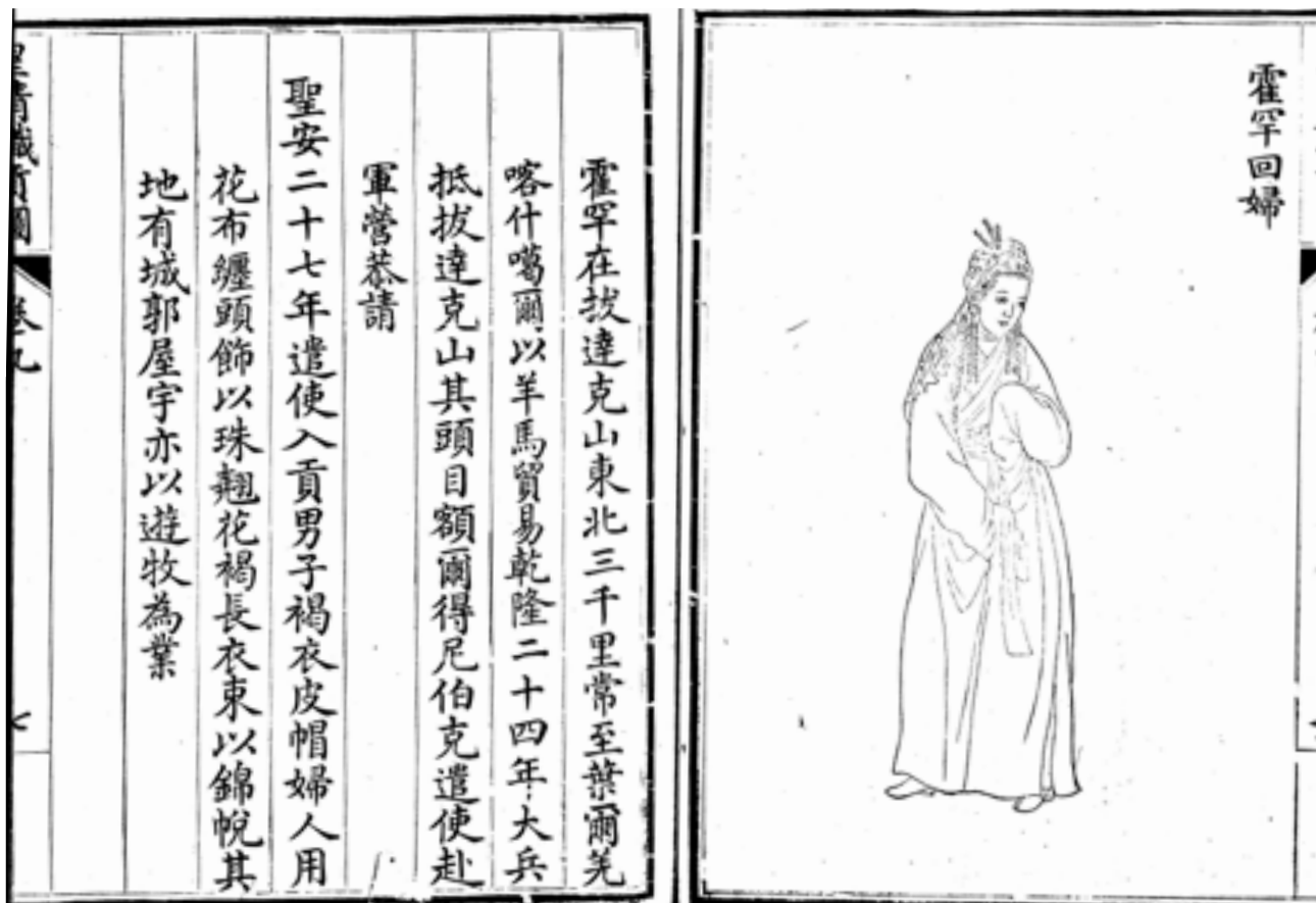
Рис.5. Мусульманка из Коканда. Рисунок из ксилографа «Изображения данников правящей династии Цин» («Хуан Цин чжи гун ту»). XVIII в. Место хранения: Восточный отдел Научной библиотеки им. М. Горького СПбГУ, шифр Хул. 348.

19 июля 1755 г. был обнародован императорский Указ о триумфальном окончании за-