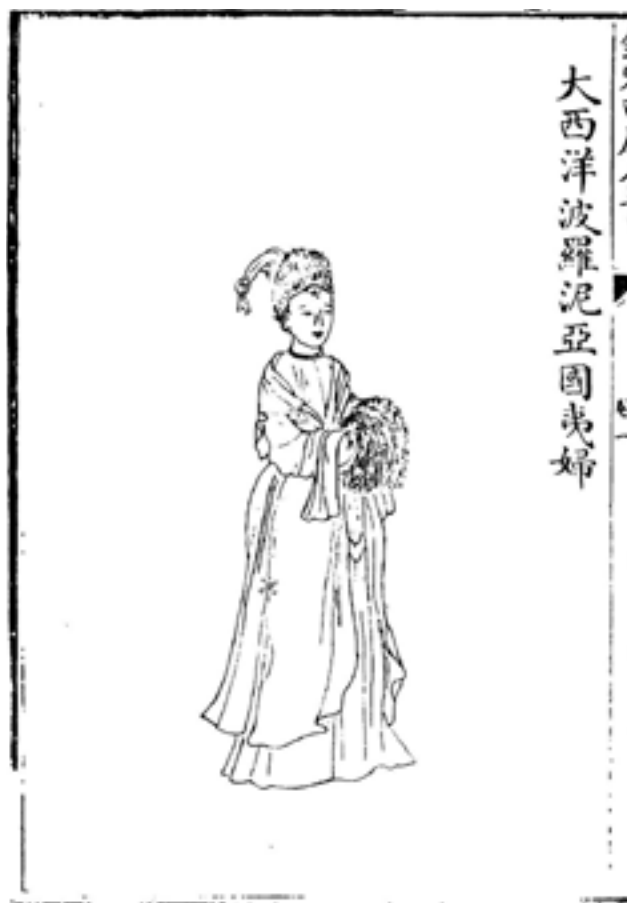
Рис.7. Польская женщина. Рисунок из ксилографа «Изображения данников правящей династии Цин» («Хуан Цин чжи гун ту»). XVIII в. Место хранения: Восточный отдел Научной библиотеки им. М. Горького СПбГУ, шифр Хл. 348.

После завоевания Джунгарии и Кашгарии Цинская империя увеличилась, и осознание собственного могущества и самодостаточности стало ключевым фактором, определявшим внутреннюю и внешнюю политику Китая во второй половине XVIII века. Ощущение всемогущества внутри и вовне