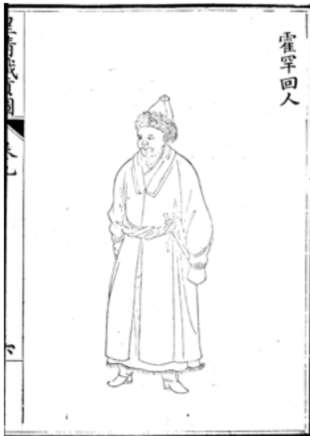
Рис.4. Мусульманин из Коканда. Рисунок из ксилографа «Изображения данников правящей династии Цин» («Хуан Цин чжи гун ту»). XVIII в. Место хранения: Восточный отдел Научной библиотеки им. М. Горького СПбГУ, шифр Хул. 348.