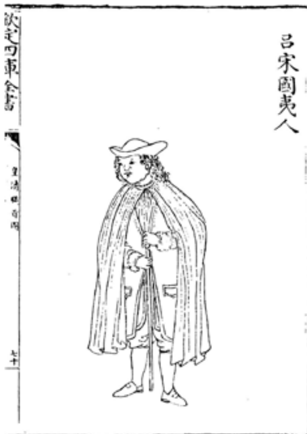
Рис.6. Испанец с острова Лусон (Филиппины). Рисунок из ксилографа «Изображения данников правящей династии Цин» («Хуан Цин чжи гун ту»). XVIII в. Место хранения: Восточный отдел Научной библиотеки им. М. Горького СПбГУ, шифр Хул. 348.

Первые контакты Цинской империи с подданными Кокандского ханства имели место в 1759 г. по инициативе цинских властей, после чего император Цяньлун в своем указе уже именовал кокандского правителя «вассалом» и предписывал сообщить ему, что если он пожелает прибыть ко двору, то будет награжден [19, цз.596]. В 1760 г.