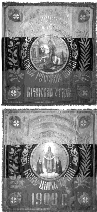
Знамя Брянского отдела Союза русского народа.

рующим признаком Российской империи для правых было православие, а лучшей системой политической власти, наиболее удовлетворяющей православному мировоззрению – царское самодержавие [25, с.228–262]. При этом правые указывали на принципиальные отличия «истинного самодержавия», ограниченного евангельским учением и исторической традицией, от западноевропейского абсолютизма [28, с.78–79]. Афористично это выразил один из видных деятелей черной сотни, отмечавший, что «Русь самодержавием строилась, а абсолютизмом болела» [41, с.6]. Считая себя идейными наследниками славянофилов, почвенников и русских консерваторов конца XIX в., русские правые продолжали отстаивать тезис об особом историческом пути России, а следовательно, выступали противниками механического заимствования западноевропейских политических институтов и идей. В равной мере являясь противниками либерализма и социализма, русские правые, вне зависимости от толков и течений, всегда выступали против буржуазных ценностей, индивидуализма, материализма, антиклерикализма, космополитизма, идеи ра-