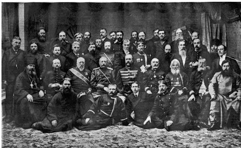
Участники монархической делегации к императору Николаю II 1 декабря 1905 г.

Сергий (Страгородский); среди членов правых партий и их покровителей было немало и других известных архиереев и священников, некоторые из которых ныне причислены РПЦ к лику святых. По подсчетам С.А.Степанова, в 1906–1908 гг. десятая часть председателей губернских отделов и почти треть председателей уездных отделов СРН являлись священнослужителями [37, с.316]. Призывы к духовенству и православным верующим вступать в ряды монархических союзов публиковались на страницах епархиальных изданий [17, 21]. Знамена правых союзов нередко выставлялись в православных храмах. Несмотря на попытки оппонентов представить черносотенное движение маргинальным, оно являлось массовым и до определенного времени пользовалось поддержкой значительной части российского общества, в отличие от политических организаций иной идеологической направленности. Однако со временем в результате внутренних распрей и расколов, допущенных ошибок и просчетов, стремления власти отмежеваться от своих защитников справа, радикализации российского общества и других факторов это преимущество правыми было утрачено. И численность правых партий и союзов после 1907 г. неуклонно снижалась, уменьшившись к Февральской революции практически в 10 раз – до 30–45 тыс. чел. [13, с.82, 417]. Такие же негативные процессы произошли в социальном составе правого лагеря, который к 1917 г. также заметно сузился.