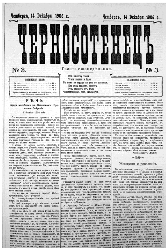
Газета «Черносотенец» (Казань)

организации – Союза русского народа (СРН) на ряд самостоятельных партий (СРН под руководством Н.Е.Маркова, Русский народный союз имени Михаила Архангела (РНСМА) во главе с В.М.Пуришкевичем, Всероссийский Дубровинский СРН и др.). Помимо конфликта между крайним и умеренным крылом черной сотни явные идейные разногласия и политическая конкуренция существовали между черносотенцами и русскими националистами – членами Всероссийского национального союза (ВНС) и родственных ему организаций: Всероссийского национального клуба, Киевского клуба русских националистов и др.). Многие консервативно настроенные сановники не только не содействовали правым партиям, но и чурались их.