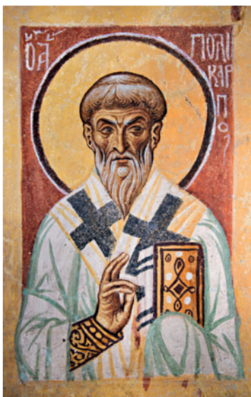
Сцмч. Поликарп Смирнский. Роспись ц. вмч. Пантелеимона в Нерези близ Скопье. 1164 г.

В памятниках Балкан или Др. Руси средневизантийского или позднего времени в зависимости от стиля мастера облик святого может приобретать неизвестные ранее черты. Его по-прежнему пишут в чине святителей, как правило, в алтаре, в жертвеннике, напр., в ц. Пантелеимона в Нерези, Македония (1164), но его лик испещрен морщинами (определен И. Синкевич; Sinkevič I. The Church of St. Panteleimon at Nerezi: Architecture. Programme. Patronage. Wiesbaden, 2000. Spätantike, Frühes Christentum, Byzanz: R. V. Bd. 6. Fig. 29; также см.: Овчарова О. В. Фрески Нерези (1164) и визант. живопись XII в.: Канд. дис. М., 2018. С. 59, 116, 126, 127). Борода может быть круглой, как в Каранлык-килисе в Гёреме (сер. — 3-я четв. XI в.; Jolive-Levy . 1991. P. 135). Его можно найти в святительском чине в апсиде ц. Панагии Мавриотиссы (1259–1265) в Кастории; в арочном проходе в виму со стороны диаконника, где П. С. изображен в паре со свт. Германом, — в ц. свт. Николая под крышей (Агиос-Николаос тис Стегис, близ Какопетрии (кон. XIII — нач. XIV в.) ( Stilianou . 1997. P. 55)). В наосе в Успенской ц. Грачаницы (ок. 1320) он показан рядом со свт. Модестом Иерусалимским;