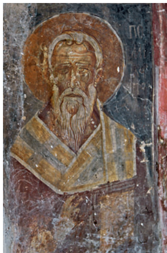
Сщмч. Поликарп Смирнский. Роспись ц. вми. Марины в дер. Пирга, Кипр. XII в. (?)

В гл. 9 Послания (Polycarp. Ad Phil. 9. 2) Игнатий и его спутники упоминаются как уже умершие; однако в гл. 13 (Ibid. 13. 2) о них говорится как о еще живых (de ipso Ignatio et de his qui cum eo sunt). Пытаясь разрешить это противоречие, П. Н. Харрисон предположил, что Послание в наст. виде является компиляцией 2 писем, написанных П. С. филиппийцам в разное время, скопированных на один свиток и из-за этого в посл. объединенных (Harrison. 1936). Первое было крат-