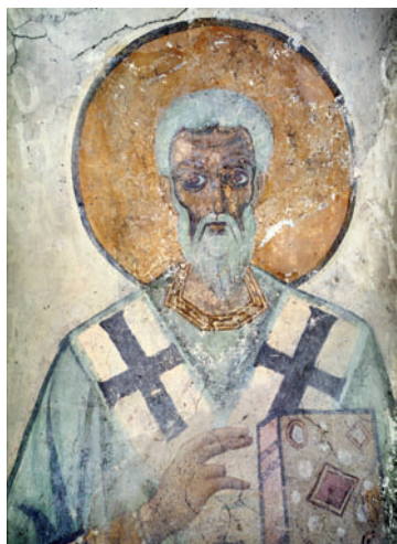
Сщмч. Поликарп Смирнский. Роспись ц. Св. Софии в Новгороде. 1109 г.

В древнерус. традиции московского периода П. С. в основном изображен в минейных циклах в рост или в виде полудигуры в святительских одеждах под 23 февр.: на северной рус. иконе с минеей на февр. (ГЭ, по мнению И. А. Шапиной — сер. XV в.), на зап. арке юго-зап. столба в ц. во имя свт. Симеона Богоприимца новгородского Зверина мон-ря (кон. 60-х — нач. 70-х гг. XV в., сохр. лишь фрагмент крещатой фелони и омофора; Лифшиц , 1987. С. 518), в греко-