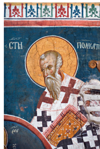
Сщмч. Поликарп Смирнский. Роспись и. Вознесения мон-ря Дечаны. Ок. 1320 г.