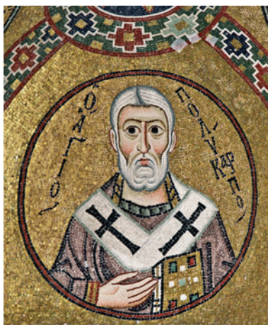
Сщмч. Поликарп Смирнский. Мозаика кафоликона мон-ря Оснос Лукас. 30–40-е гг. XI в.