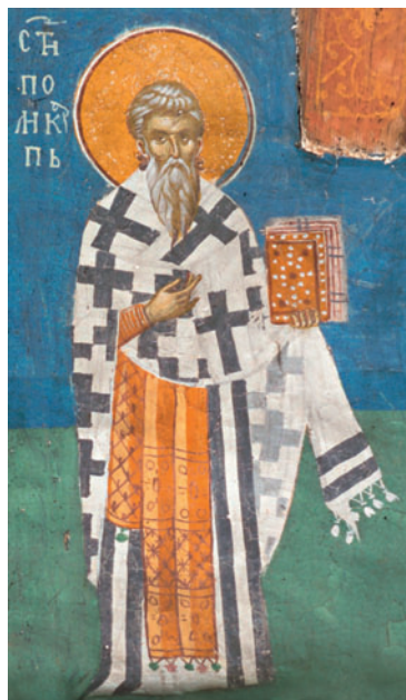
Сщмч. Поликарп Смирнский.

Мученичество П. С. — важнейший памятник раннехрист. агиографии, первый текст, рассказывающий о мученической смерти исторической личности, к-рая известна и по др. надежным источникам. П. С. стал примером для др. мучеников, а его