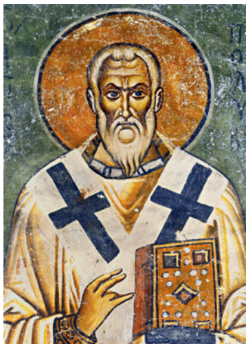
Сщмч. Поликарп Смирнский. Роспись ц. Св. Софии в Охриде. 1037–1056 гг.

Ч. Хилл выдвинул гипотезу о том, что упоминаемый сщмч. Иринею Лионским пресвитер, ученик апостолов (Iren. Adv. haer. IV 27. 1–32. 1), есть не кто иной, как П. С. Он же, по мнению ученого, является предполагаемым автором «Послания к Диогнету» (Hill. 2006). Если принять эту гипотезу, то несколько меняется восприятие личности П. С.: он предстает как выдающийся оратор и учитель, знакомый с риторическими приемами «второй софистики» (ср.: Kozłowski. 2011), умело отстаивавший истину христианства перед иудеями и язычниками, хорошо разбиравшийся