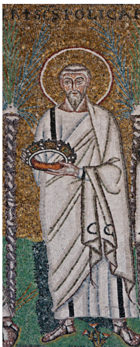
Сщмч. Поликарп Смирнский. Мозаика Сант-Аполлинаре-Нуово, Равенна. 60-е гг. VI в.

Во время понтификата св. Аникета (154/5–165/6) П. С. посетил Рим. Главной целью визита было решение вопроса о времени Пасхи: малоазийские Церкви, ссылаясь на авторитет апостолов, в частности ап. Иоанна Богослова, защищали традицию праздновать ее в день иудейской Пасхи (14 нисана), на какой бы день недели это число ни приходилось; Римская, Александрийская, Коринфская и Палестинские Церкви настаивали на праздновании в 1-е воскресенье после иудейской Пасхи. П. С. и Аникет не пришли к согласию, но сохранили общение, и П. С. даже совершил Евхаристию в Риме ( Euseb. Hist. eccl. V 24. 16–17 ). Как свидетельствует сщмч. Ириней, во время этой поездки П. С. вел борьбу с маркионитами, валентинианами и др. еретиками и добился возвращения в Церковь многих, кто обратились к лжеучениям. При личной встрече с Маркионом П. С. на вопрос: «Узнаешь меня?» — ответил: «Узнаю первенца сатаны! (ἐπιγινώσκω τὸν πρωτότοκον τοῦ σατανᾶ)» ( Iren. Adv. haer. III 3. 4 ; Euseb. Hist. eccl. IV 14. 7 ). По возвращении в Смирну П. С. претерпел мученическую смерть.