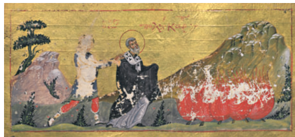
Мученичество сщмч. Поликарпа Смирнского. Миниатюра из Минология. 2-я четв. XI в. (ГИМ. Греч. № 376 (Син. греч. № 183). Л. 106)

В Житии, написанном Псевдо-Пионием, содержатся иные сведения о П. С.: он родился где-то на Востоке, был привезен в Смирну и продан в рабство некоей Каллисте, к-рая