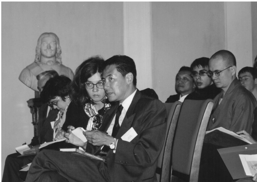
2 октября 2000 г. Петровский зал СПбГУ. Китайские участники конференции