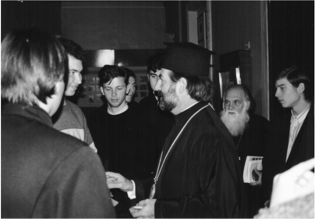
6 октября 2000 г. 4-я конференция «Православие на Дальнем Востоке». Митрополит Гонконгский и Юго-Восточной Азии Никита (Лулиас) беседует со студентами Санкт-Петербургских духовных школ

книги на китайском. Евангелие на китайский язык было переведено бывшим членом нашей Пекинской миссии Липовцовым, а издано Лондонским Миссионерским обществом. Китайские книги большею частью переводы с русского нынешней Пекинской Миссии. Как маньчжурские, так и китайские переводы оказались понятными для амурского, маньчжурского и китайского населения и ими-то и пользуется Амурская миссия для распространения христианских понятий между живущими около Благовещенска язычниками» 12 .