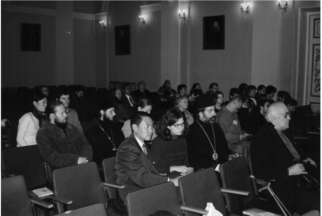
6 октября 2000 г. Актовый зал духовной академии. 4-я конференция «Православие на Дальнем Востоке»

епископа Тихвинского Константина (Горянова) (ныне митрополит Петрозаводский и Карельский).