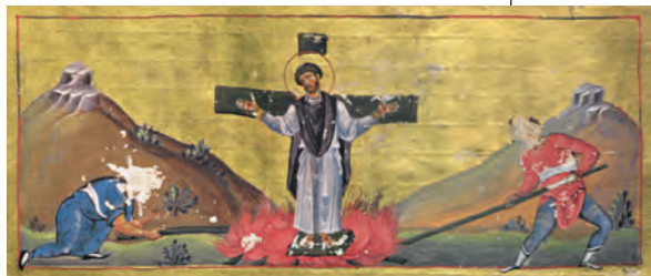
Мученичество св. Пиония. Миниатюра из Минология. 2-я четв. XI в. (ГИМ. Греч. № 376 (Син. греч. № 183). Л. 202 об.)

собранных язычников и иудеев не издеваться над отступниками. Иудеям не стоит смеяться над страдающими из-за несправедливости христианами, ведь, как свидетельствует Свящ. Писание, они сами неоднократно не по принуждению, а по собственной воле отступались от Бога. Происходящие гонения — признак