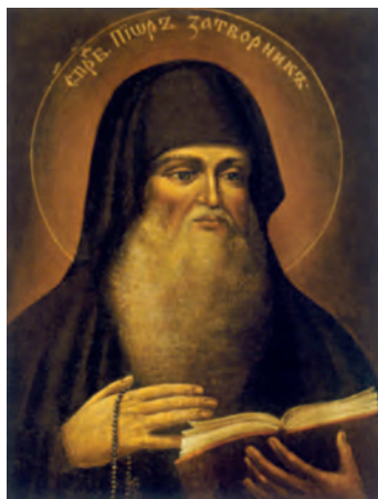
Прп. Пиор Затворник. Икона. 40–50-е гг. XIX в., прориси нач. XXI в. (Дальние пещеры Киево-Печерской лавры)

ПИОР , прп. (пам. 28 авг.— в Собо-ре преподобных отцов Киево-Печер-ских, в Дальних пещерах (прп. Феодосия) почивающих, во 2-ю Неделю Великого поста — в Соборе всех пре-подобных отцов Киево-Печерских), Киево-Печерский, Затворник, в Даль-них пещерах почивающий. Не упо-