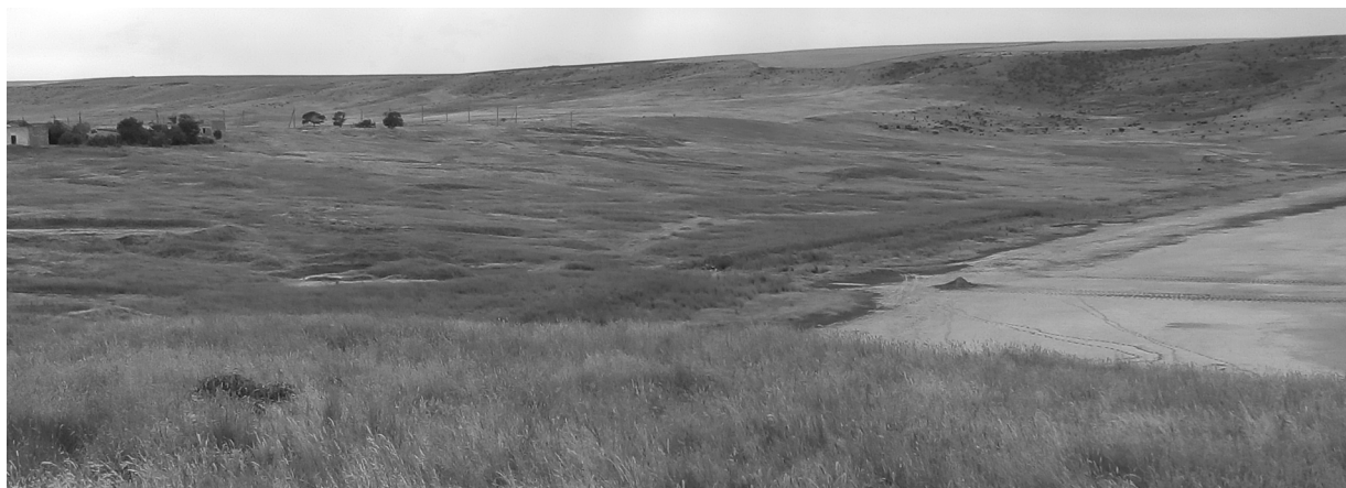
Рис. 2. Чонгелекская (Приозерная) площадь (фото Е.П. Каюковой, .2017 г.)

Чонгелекское месторождение, названное так по ближайшему селу Чонгелек Русский (с 1948 г. и по настоящее время – с. Костырино), расположено в непосредственной близости от крупного соляного Тобечикского озера лиманного типа (рис. 2).