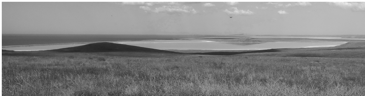
Рис. 1. Озеро Тобечик, вид со стороны д. Костырино

Добыча нефти в районе Керчи велась еще в IV-V вв. н.э., о чем говорят археологические раскопки. Так, в 1939 г. при раскопках античного города Тиритаки найдена отлично сохранившаяся глиняная амфора IV в. н. э., наполненная нефтью, которая, благодаря герметической укупорке, сохранилась в сосуде в жидком виде [21]. Химический анализ показал, что нефть принадлежит Чонгелекскому месторождению [3], расположенному на западном берегу Тобечикского озера в 20 км юго-западнее города Керчь (рис. 1).