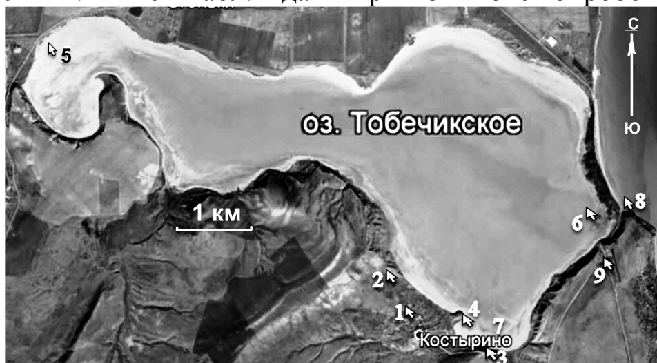
Рис. 1. Расположение точек опробования

На рисунке 1 представлена схема полевых опробований за 2013-2014 гг. Ниже в табл. 1 даны привязки точек опробования.