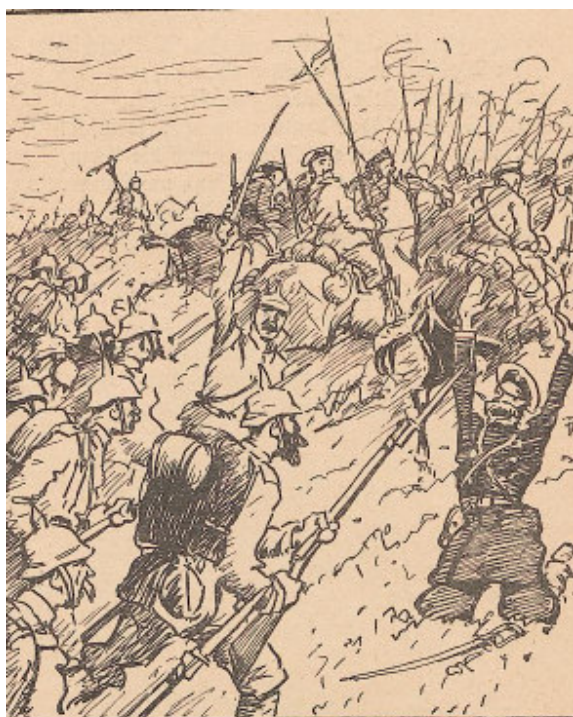
Die Kosaken vor der deutschen Landwehr.

Чтобы как-то существовать в условиях жесткой цензуры, публикации журнала «Der Wahre Jacob» приобрели умеренно социалистический характер, а цветные карикатуры на политические темы, обеспечивали хорошую продаваемость. «Ulk» стал еженедельным приложением к более крупным изданиям. «Simplicissimus» являлся умеренным изданием по отношению к власти, чрезмерно жестких и критичных заметок не печатал, изображения и картинка были официального стиля, выдержанные, недвусмысленные.