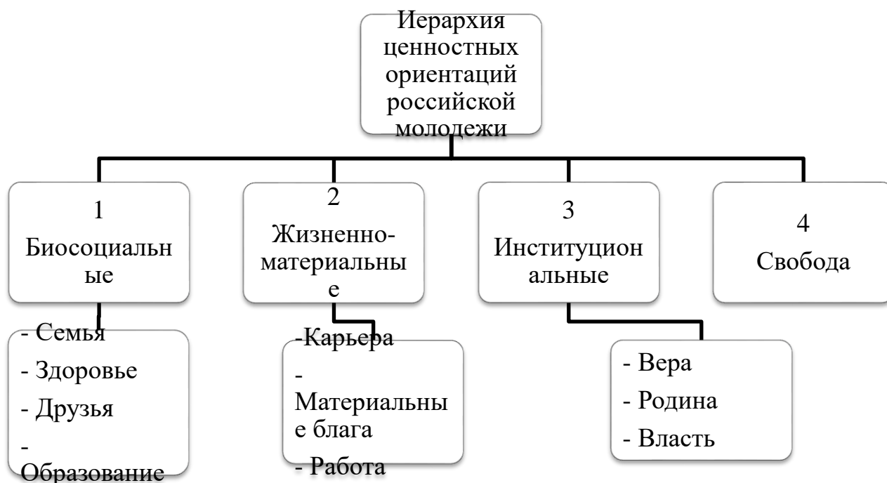
Рисунок 2. Базовые ценностные установки российской молодежи

Рассмотрим одну из приоритетных установок молодёжи – здоровый образ жизни. По данным того же исследования 30% молодёжи считают себя абсолютно здоровыми, 60 % отметили, что болеют обычными болезнями, примерно 10 % опрошенных сказали, что имеют хронические заболевания, в том числе около 1% имеют группу по инвалидности. При предпочтительными занятиями досугового характера являются просмотр видео, прослушивание музыки и встреча с друзьями, также большое количество времени у молодёжи занимают игры и работа на компьютере, и переписка в интернете. Занятиям спортом уделяют время в большей степени школьники и студенты, в меньшей степени – работающая молодёжь.