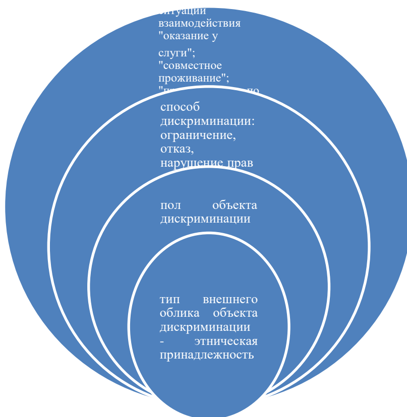
Рис.1. Эмпирическая модель изучения этнолукизма, направленного на представителей этнических групп, отличающихся типом внешнего облика.

В данной эмпирической модели (см. рис.1) представлены взаимосвязанные характеристики дискриминационного поведения (ситуации дискриминации, способы дискриминации), а также характеристики объекта дискриминации – человека, на которого направлены дискриминационные действия и который принадлежит к определенной гендерной группе, имеет тип внешнего облика, ассоциированный с этнокультурными группами. В обществе, в обыденном общении интегрированные обобщенные обозначения этно-культурных групп представлены в виде словосочетаний: «лица кавказской национальности», «лица славянской внешности»[11,30,31].