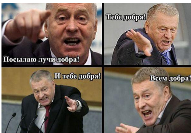
Рис. 8. Демотиватор с В. В. Жириновским

ства массовой коммуникации, породил массу мемов различной тематики, но всегда имеющий экспрессивную эмоциональную окраску (рис. 8).