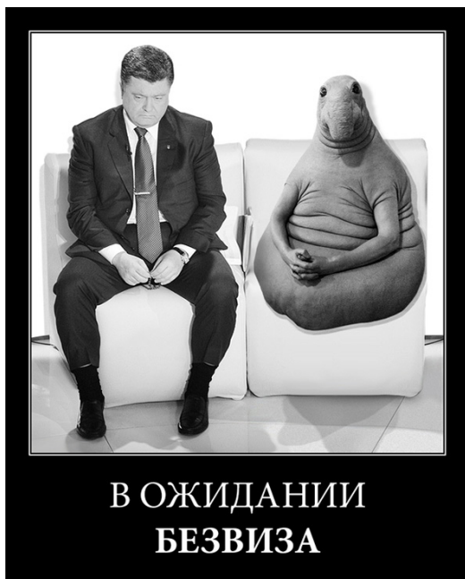
Рис. 5. Демотиватор с П. Порошенко и Ждуном «В ожидании безвиза»

Этот пример наглядно демонстрирует, как изначально аполитичный персонаж может оказаться инструментом формирования политической повестки дня, причем влиять на нее как в положительном, так и в отрицательном ключе.