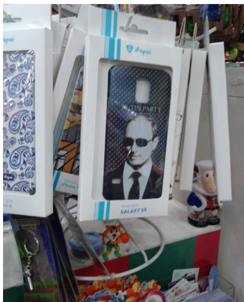
Рис. 2. Чехол для смартфона с изображением В. В. Путина с портретом и надписью Putin Party