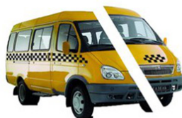
Рис. 4. «Половина маршрутки»