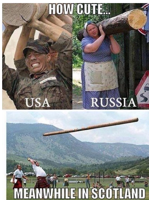
Рис. 7. Тем временем в Шотландии

В качестве знаковой и запоминающейся темы для мема могут также выступать как исторические периоды, например советское прошлое, ставшее за последние 15 лет объектом как символизации, так и мифологизации. 115 Однако, как правило, в рамках пространства социальных сетей, как правило, происходит отсылка скорее к элементам советской культуры и иногда знаковых событий, нежели к политике и политическим событиям. Советские лидеры для интернет-аудитории также переходят в разряд исторических персонажей, нежели идеологических.