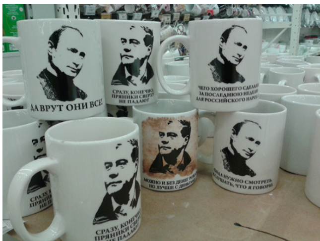
Рис. 1. Кружки с известными высказываниями В. В. Путина и Д. А. Медведева