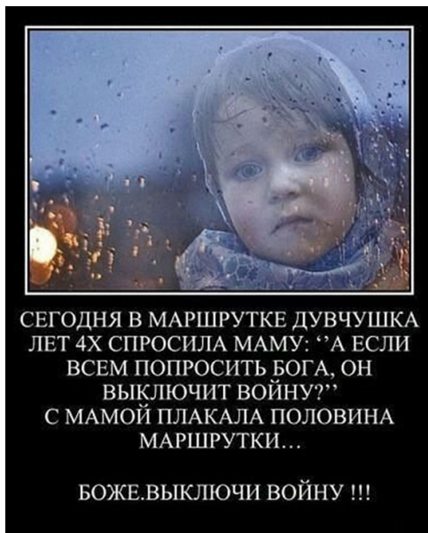
Рис. 3. Демотиватор «Плачущая половина маршрутки»

половина лица пользователя закрывается маршруткой и в момент речи из ее окон льются крупные слезы.