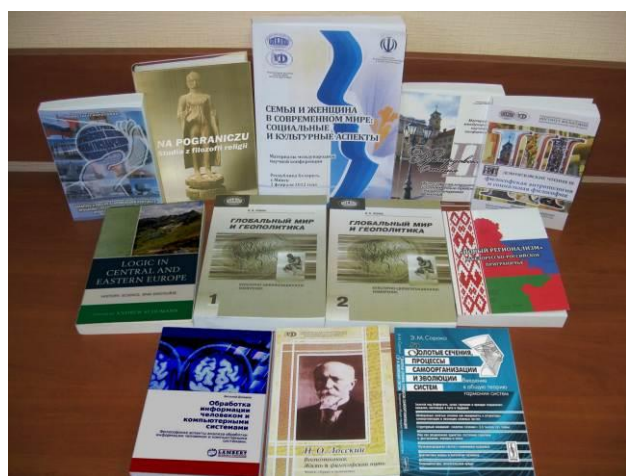
Издания Института философии НАН Беларуси, 2010 – 2013 гг.