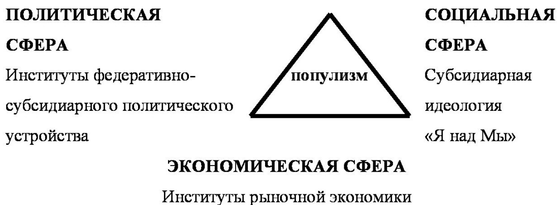
Рис. 1. «Y-матрица» дискурса «популизм»

терминах популизма, политика которого, выражаясь словами Д.В. Нежданова, «это политика минимизации потерь, а не максимизации прибыли» (Нежданов, 2001, 33).