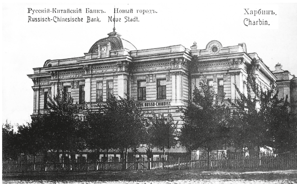
Здание Русско-Азиатского банка в Харбине, почтовая открытка