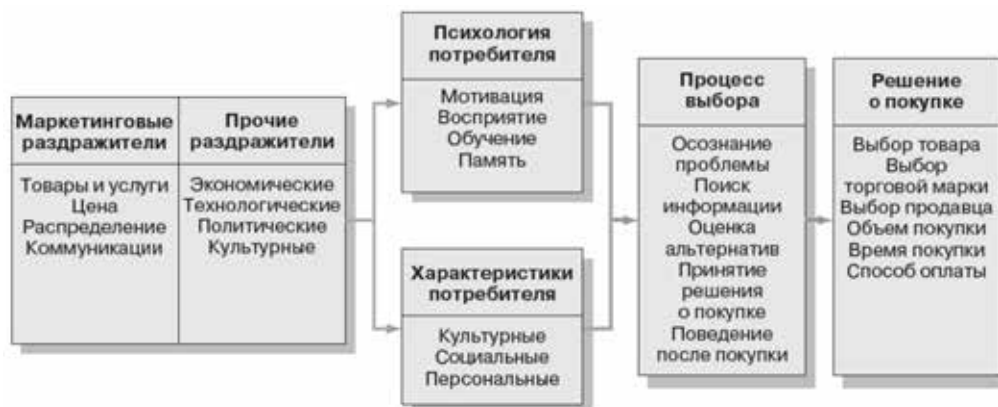
Модель поведения потребителя Ф. Котлера (Котлер, Келлер, 2014)

потребителя с его психологическими особенностями, культурными, социальными, персональными характеристиками.