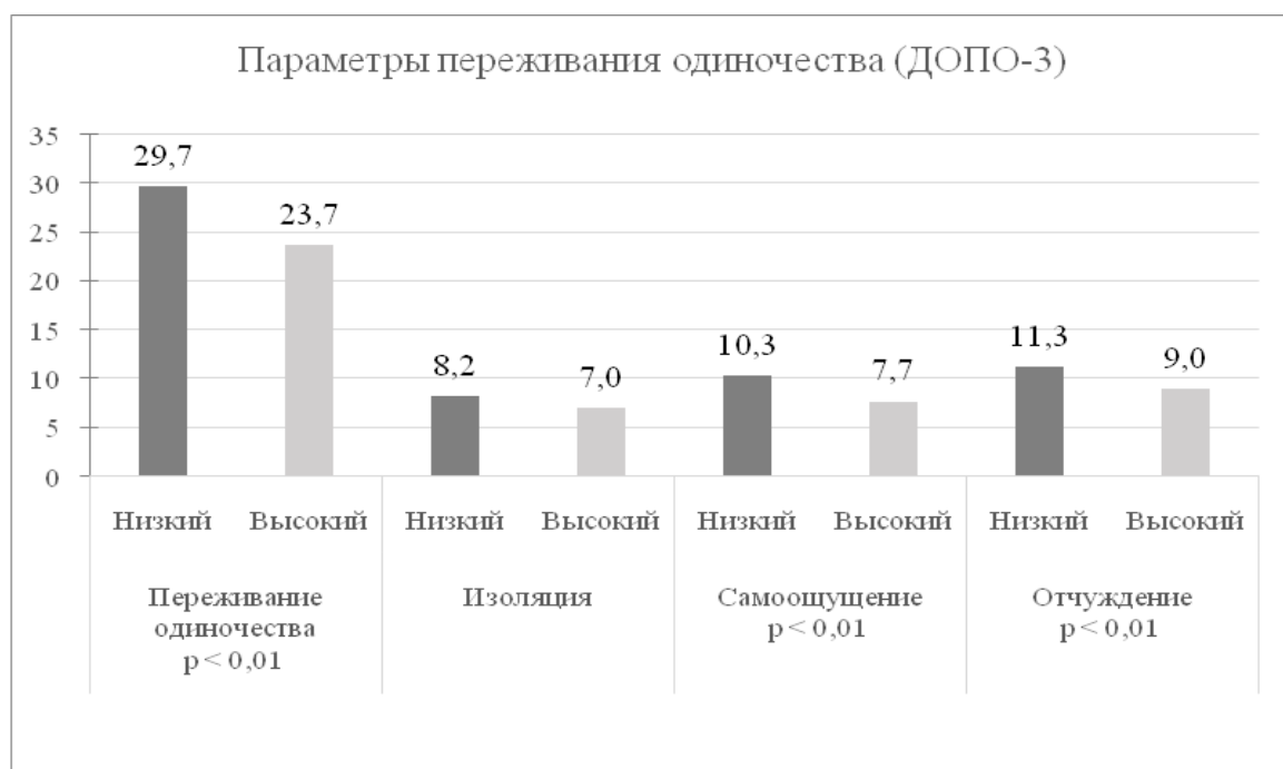
Рисунок 2 – Различия по параметрам переживания одиночества в группах с «высоким» и «низким» уровнем осознанности

«зависимости от общения» значимых различий между группами обнаружено не было. Различия были выявлены лишь по шкале «общее переживание одиночества» и ее субшкалам, а также по шкале социального и эмоционального одиночества, результаты представлены на рисунках 2 и 3.