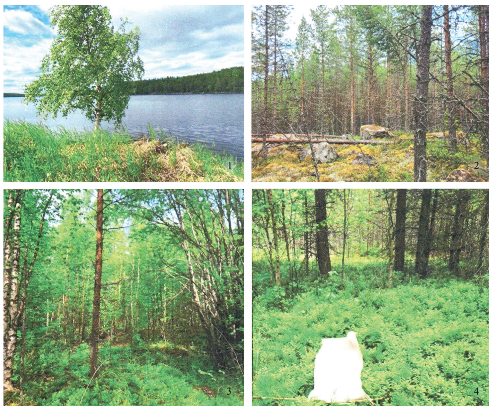
Рисунок 2. Различные биотопы (1--4) в местах обнаружения клещей на острове Средний. Figure 2. Biotopes 1–4 in places where ticks collection.

Картографирование производилось с помощью свободной кроссплатформенной геоинформационной системы QGIS. Основой для разработки картографического материала послужила электронная карта масштабом 1:15000000 в системе координат EPSG:4326 – WGS 84. На основу был наложен точечный векторный слой месторасположения метеостанций. В атрибутивную таблицу данного слоя вносился номер метеостанции, соответствующий номеру в исходной таблице, которая была составлена в MS Excel, и данные рассчитанных значений климатических параметров. После этого осуществлялись преобразование и импорт атрибутивных данных, т.е. привязка созданной таблицы к слою в GIS. Таким образом, был получен слой с атрибутивной таблицей, содержащей название метеостанции и рассчитанные значения климатических параметров.