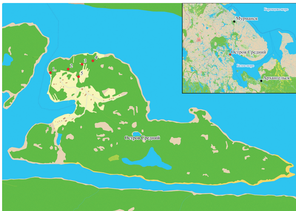
Рисунок 1. Остров Средний, места сбора клещей. Биотопы в точках сбора 1–4 показаны на рис. 2. https://www.openstreetmap.org/#map=3/46.92/-11.60