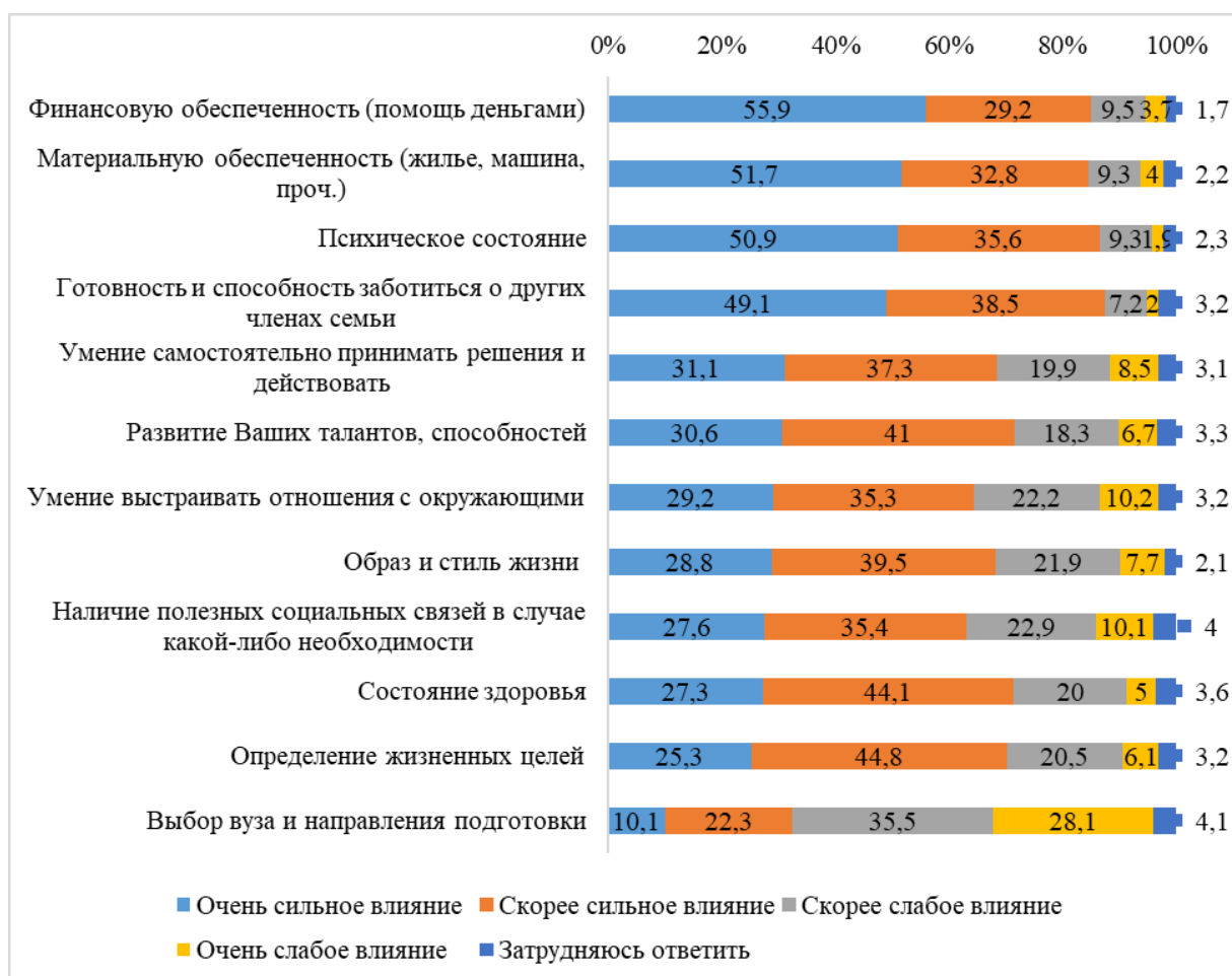
Рис. 1. Представления респондентов о влиянии семьи на различные аспекты их жизни (в %)

Значительная часть опрошенных признает существенное влияние семьи на обладание/доступность им различных видов капиталов/ресурсов, а также формирование их габитуса, образа/стиля жизни, ценностно-мотивационного ядра: развитие Ваших талантов, способностей (71,6%); состояние здоровья (71,4%); определение жизненных целей (70,1%); умение самостоятельно принимать решения и действовать (68,4%); образ и стиль жизни (68,3%); умение выстраивать отношения с окружающими (64,5%); наличие полезных социальных связей в случае какой-либо необходимости (63%). При этом обучающиеся по направлениям подготовки социально-гуманитарного характера (72,7%) немного чаще указывают на вклад семьи на определение их жизненных целей, чем естественно-научного (66,7%) и математико-информационного (63,7%). Аналогично и в отношении навыка выстраивания отношений с окружающими: социально-гуманитарные (66,1%), естественно-научные (60,6%), математико-информационные (52%) направления подготовки. Сохраняется значимая роль семьи в формировании образа мысли, действия и восприятия реальности молодых людей.