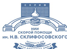
ГБУЗ «Научно- исследовательский институт скорой помощи им. Н.В. Склифосовского Департамента здравоохранения города Москвы