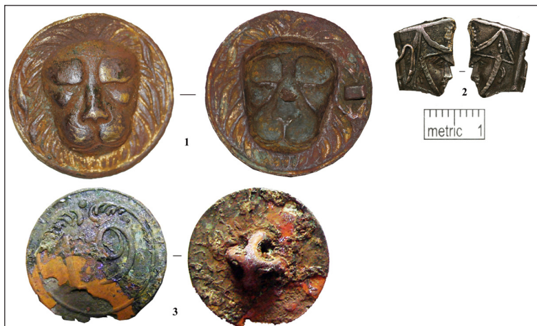
Рис. 2. Материалы из раскопок на месте дома Н.Ф. Мусина-Пушкина на набережной Фонтанки.

1 – бляшка с изображением львиной морды (сплав на основе меди, позолота); 2 – фрагмент солдатики, так называемой «нюрнбергской фигурки» (свинцово-оловянистый сплав); 3 – пуговица 19-го линейного полка Великой армии (сплав на основе цинка)