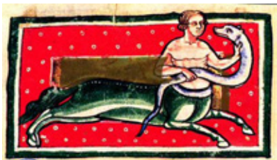
Оноцентавр со змеем. Lat. Q.v.V. № 1 (Санкт-Петербургский bestiарий), f. 11v. Англия (Линкольншир, Йорк или центральная Англия ?). 1170–1185 Пергамен, органические краски, накладное золото Российская Национальная библиотека, Санкт-Петербург