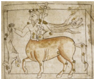
Созвездие Кентавра. Ms. Bodl. 614 (S.C. 2144), f. 33r. Англия 1120–1140 Пергамен, органические краски Бодлианская библиотека, Оксфорд

Лондон) она все еще имеет грушевидную форму, но уши и черты морды натуралистично проработаны; в Cotton Ms. Tiberius C.1, f. 31v (Британская библиотека, Лондон), датируемой приблизительно 1122 годом, морда зверя вытягивается. В Ms. Bodl. 614, созданной в 1120–1140 годах, и Digby Ms. 83 последней четверти XII века, морда вытягивается еще больше, уши заостряются, глаза приобретают каплевидную форму, а пасть разинута. В Digby Ms. 83 у основания ушей заметны пучки шерсти. Шкуры теперь располагаются почти перпендикулярно крупу Кентавра.