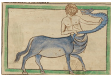
Оноцентавр со змеем. Ms. 100 (Нортумберлендский bestiарий), f. 9v. Англия. Около 1250–1260 Пергамен, органические краски Музей Дж. Пола Гетти, Лос-Анджелес