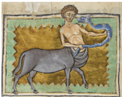
Оноцентавр со змеем. Royal Ms. 12 С XIX, f. 8v. Англия (Дарем?). Около 1200–1210 Пергамен, органические краски, накладное золото Британская библиотека, Лондон