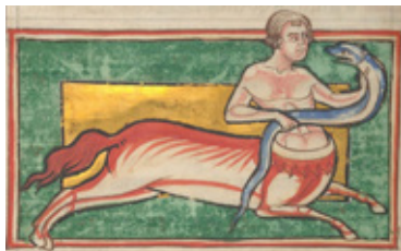
Оноцентавр со змеем. Ms. 81 (Бестиарий Моргана), f. 10v. Англия, (Линкольн, Йорк или Дарем ?) Около 1185 Пергамен, органические краски, накладное золото Библиотека Моргана, Нью-Йорк