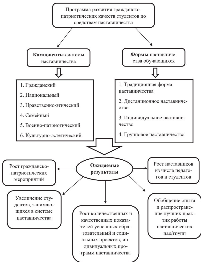
Рис.1. Модель разработанной программы

В таблице 1 отображено содержание разработанной программы, которая может реализовываться в рамках системы наставничества с обучающимися вузов.